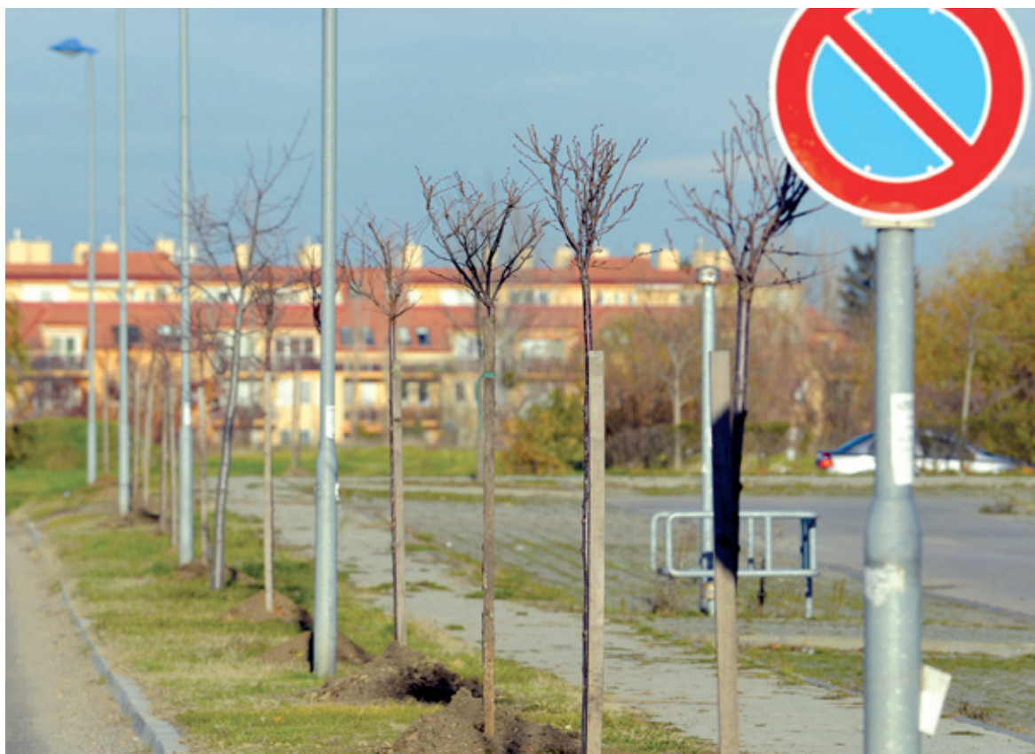
Az ősszel telepített fák néhány éven belül kerületünk díszei lesznek

Csaknem ötszáz fával gazdagodik a környezetünk