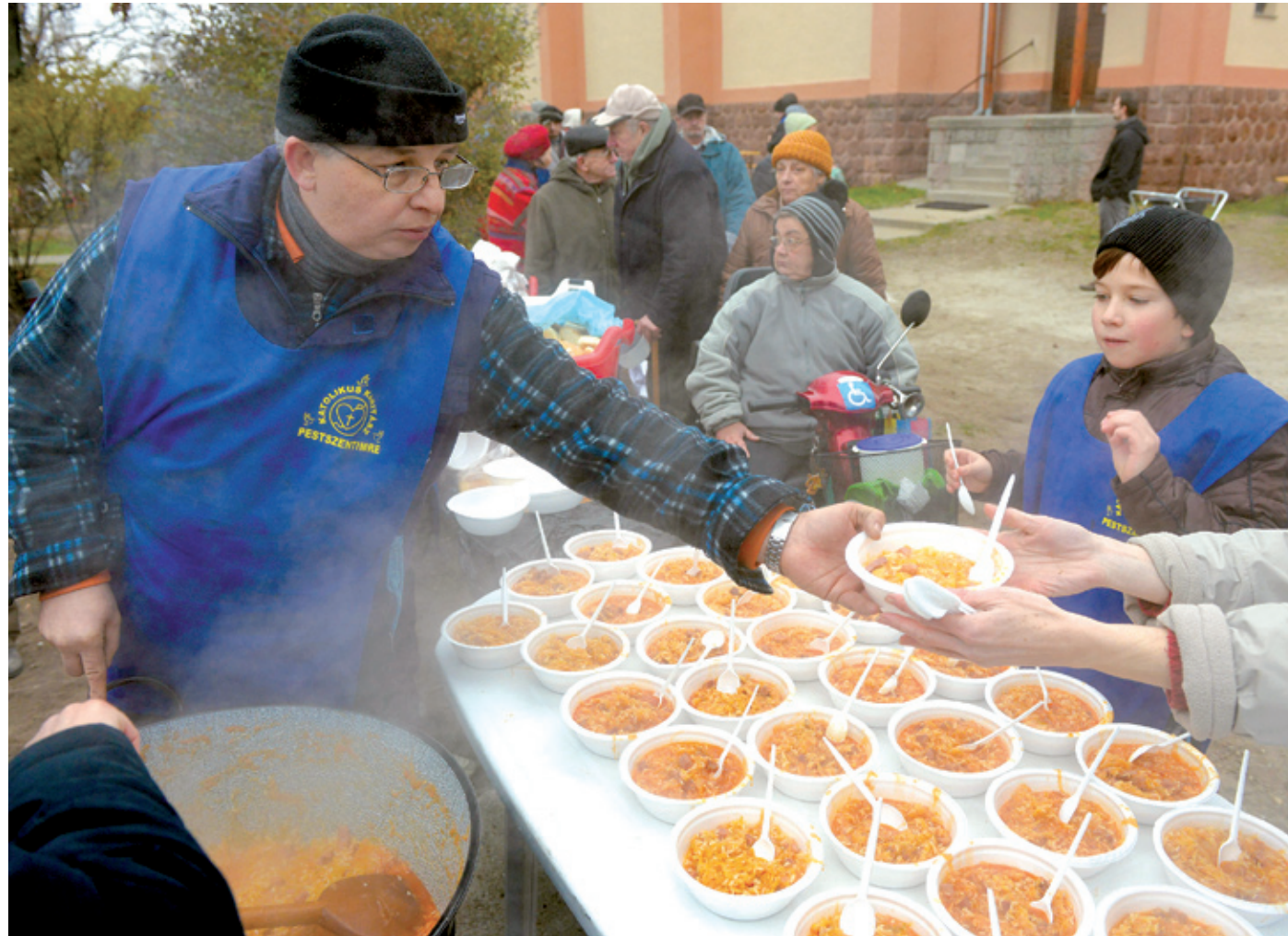
A gőzölgő székelykáposzta sokaknak hozott meleget a hideg decemberbe

Száznál többen laktak jól az imrei karitásznak köszönhetően