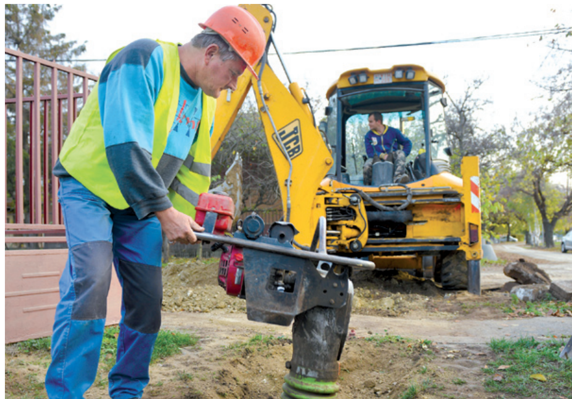
Legyünk óvatosak a csatornabekötéseknél, mert akadnak, akik a lakók hiszékenységét igyekeznek kihasználni

Teljes helyreállítás várható a csatornaépítésben érintett utcákban