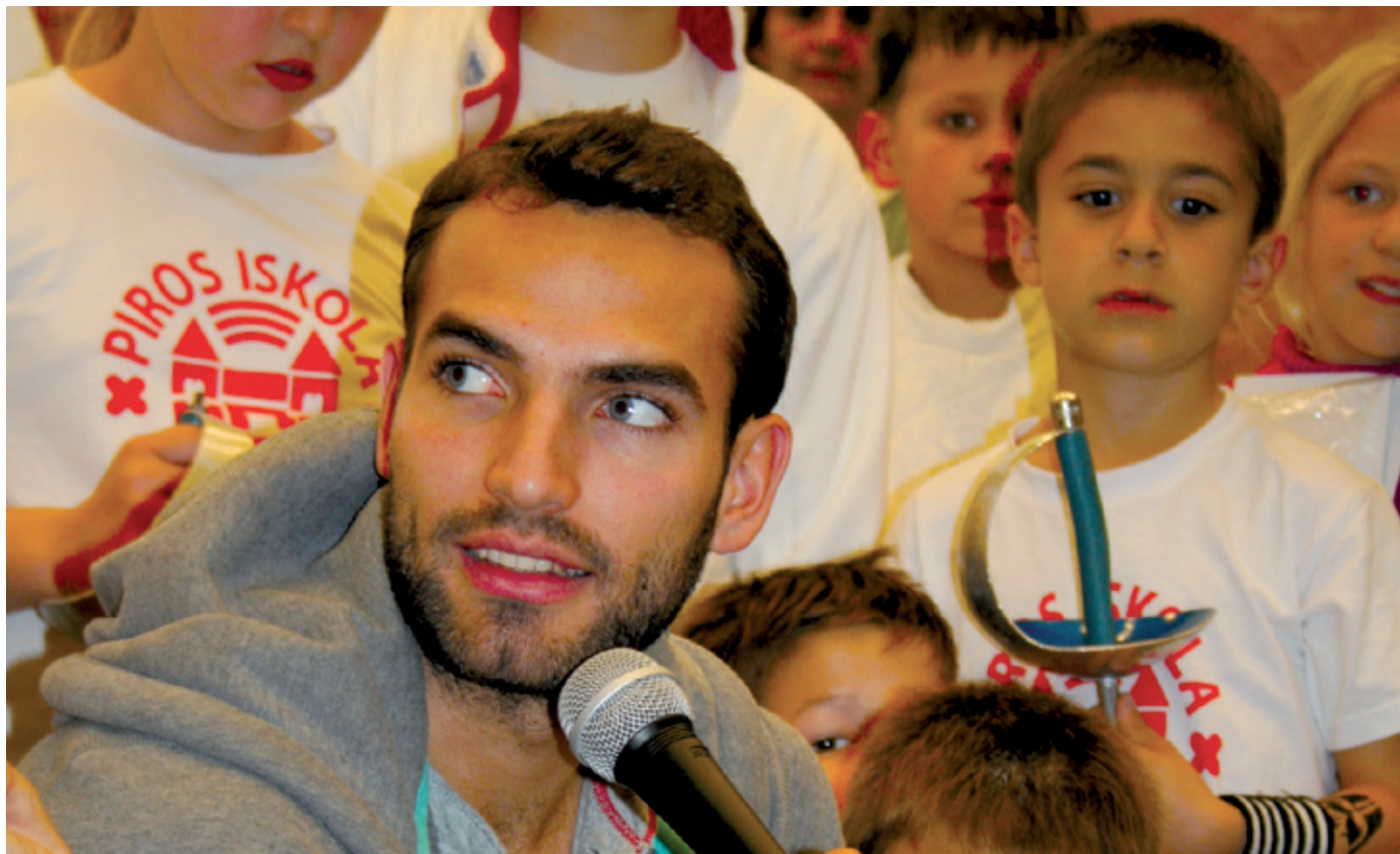
Az olimpiai bajnok Szilágyi Áront körberajongták az ifjú vívópalánták

Magyar sikersportág is szerepel a lőrinci német nemzetiségi iskola sportmenüjében. Immáron harmadik éve oktatják a vívást a gyerekeknek a tágas, világos tornateremben. Edzést látogattunk meg, az edzővel beszélgettünk.