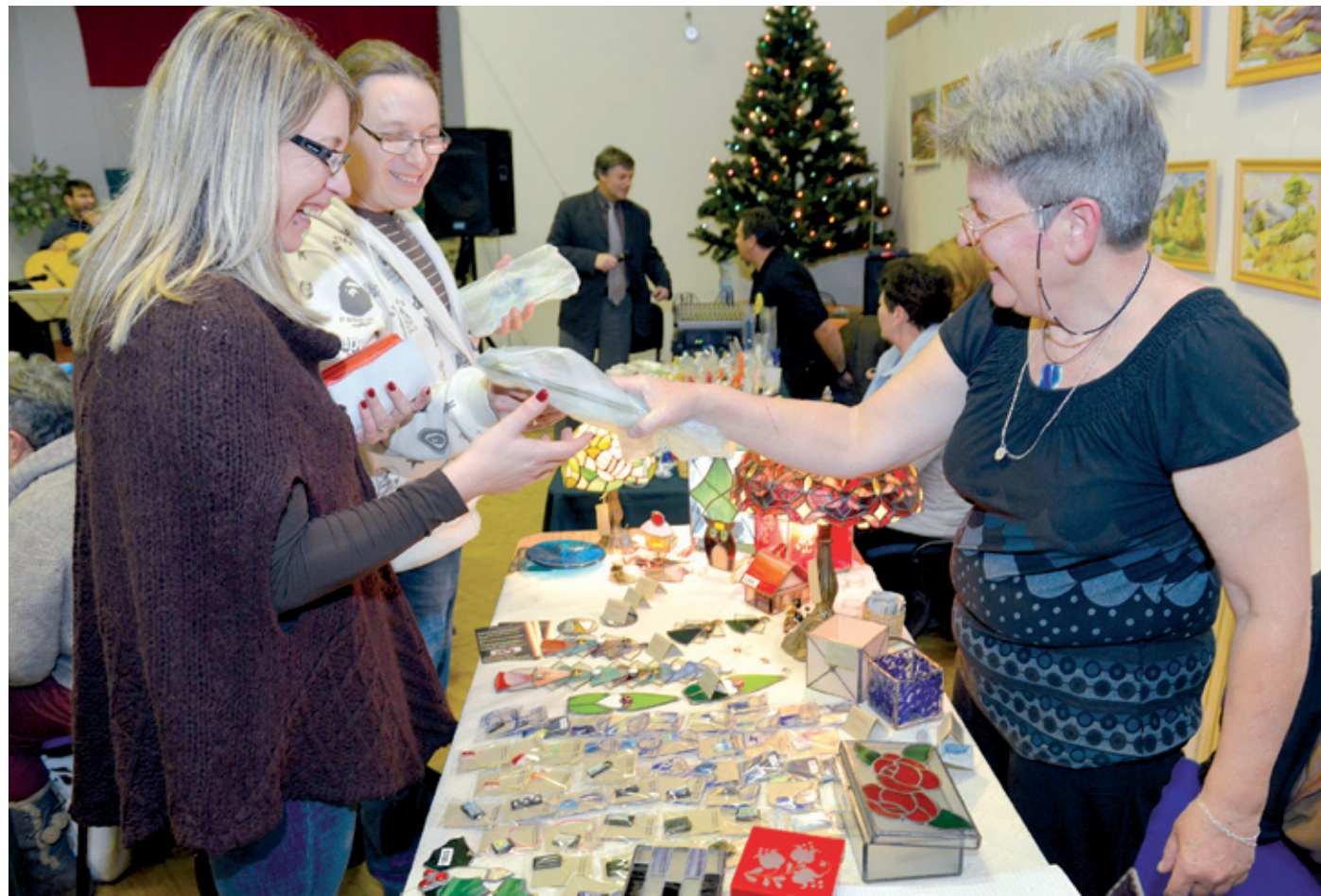
Színvonalas iparművészek termékeit is kínáltak az adventi vásáron