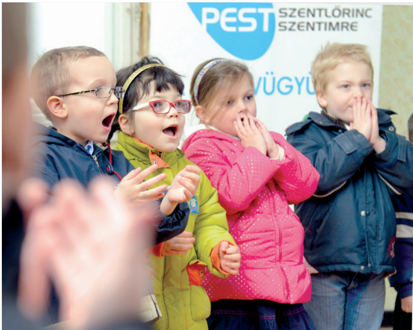
A Méhecske csoport tagjai a majdani játszóhelyükről szóló dalokkal, mondókkal készültek

A Szélső utcai régi általános iskola épületének átépítésével kap új óvodát Pestszentimrén. Az óvodai férőhelyek számának növelése fontos lakossági igénynek tesz eleget, és hogy ez mennyire így van, azt a december 9-i projektindítón a szülőkkel együtt megjelenő kisgyerekek száma is mutatta.