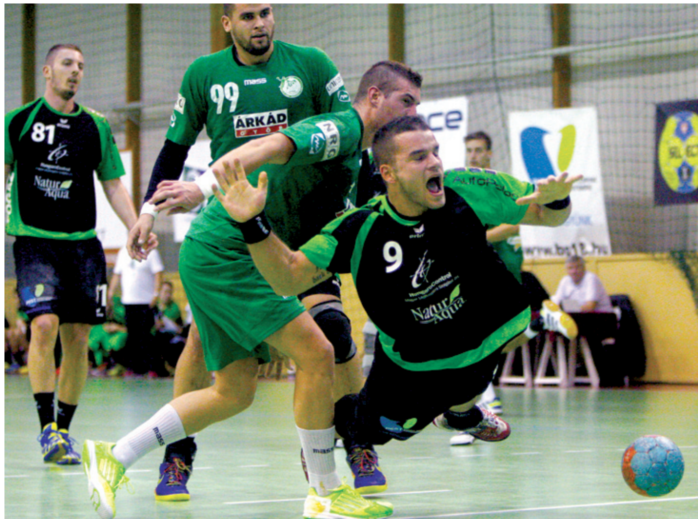
A válogatott játékosokkal felálló Csurgó túl nagy falat a megfiatalított PLER-nek