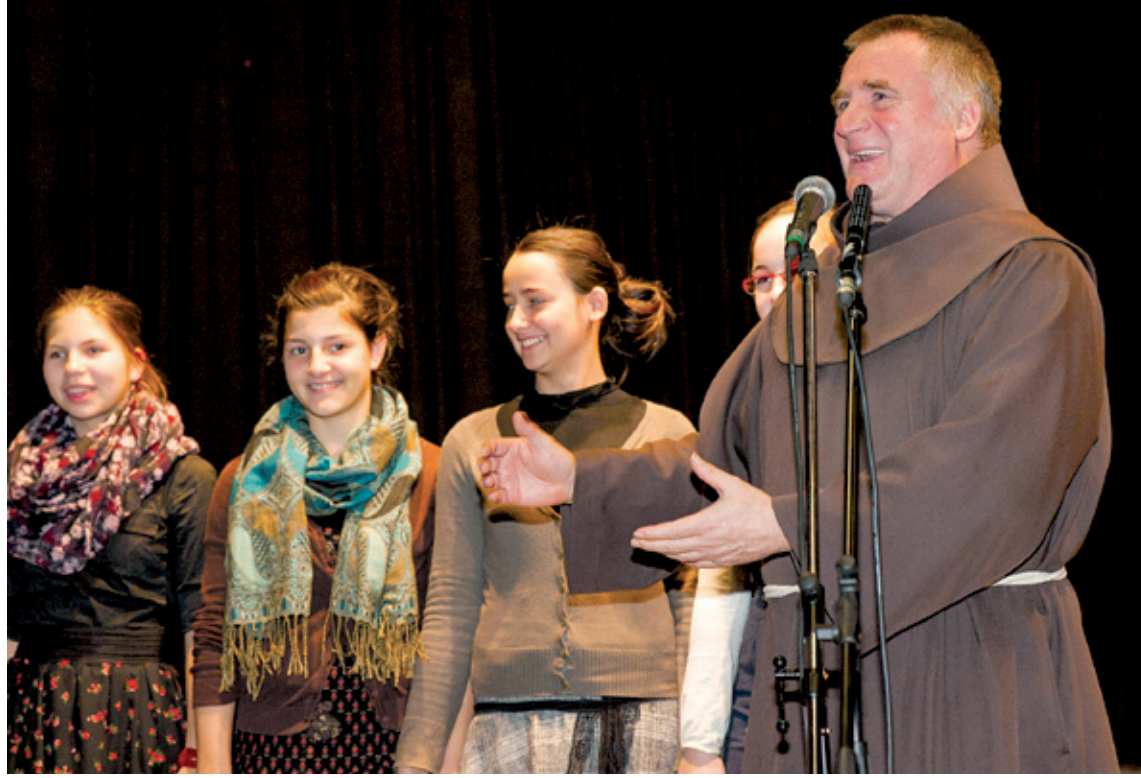
Böjte Csaba testvér eddig mintegy 5000 fiatalnak biztosított gondtalan gyermekéveket

Böjte Csaba élete a 90-es évek elején gyökeres fordulatot vett. Több helyen eltöltött papi szolgálata után Dévára helyezték, ahol otalmába fogadott néhány utcagyereket. Tevékenységét azóta elismerik egész Erdélyben, Romániában és Magyarországon. Csaba testvér a nehéz sorsú, sokszor az éhhalál szélén tengődő gyerekek és árvák felkarolásával foglalkozó Dévai Szent Ferenc Alapítvány létrehozója.