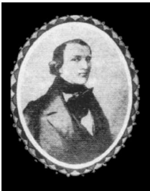
J. K. Mertz portréja

hangszer történetében. Életének első harmincnégy évében Pozsonyban élt, rendszeresen fellépett itt, majd 1840 körül Bécsbe települt. Darabjai a zongorairodalom hatását tükrözik, írásmódjára jellemző Schubert, Schumann, Chopin, Mendelssohn és Liszt stílusa, akiket személyesen is ismert. Nagyon sok divatos operarészletet dolgozott fel operafantáziáiban, melyekben megjelennek az operairodalom változatos zenei fordulatai.