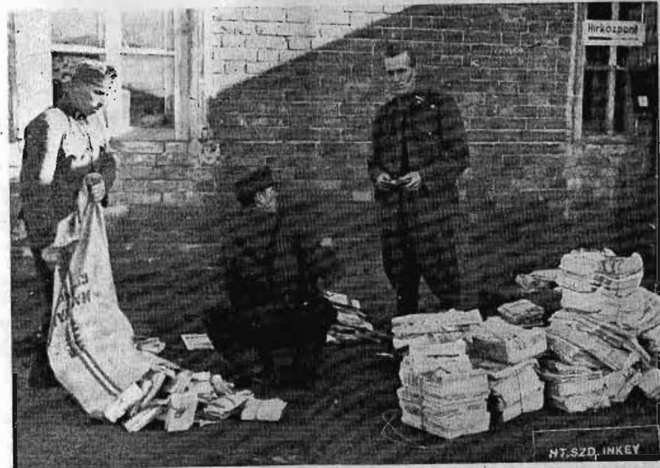
Dolgozik a tábort posta.