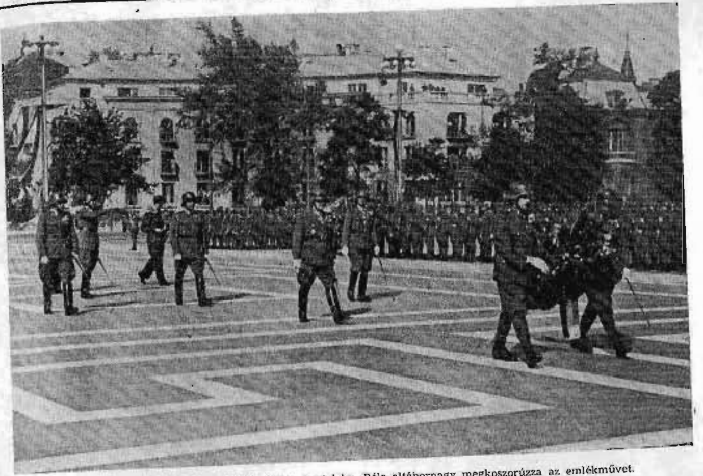
Honvédnep Budapesten. A Hősök terén Aggteleky Béla altábornagy megkoszorúzza az emlékművet.

A strici adja a szerelmet, a leányt nem engedi a keresztanyjához, pár nap múlva elfogy a pénz a lakásban, kiderül, hogy a banya nem mamája a fiúnak, követeli az ágyrajárártól a bért s a strici ekkor