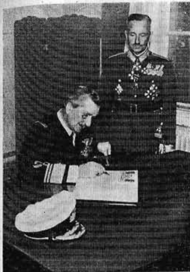
Kormányzó Urunk beírja nevét látogatása alkalmával a Hadiakadémia emlékkönyvébe.

c) Kisebb létszámú alakulataink (főleg külörsök) marhahússzükségletét csak a polgári húselosztás vonalán lehet biztosítani. Kétségtelen, hogy az itt fennálló nehézségek nem pusztán háborús jelenségek. Mindenki előtt köztudomású, aki a falusi életet ismeri, hogy a legtöbb községben rendszeres marhahúsellátással békeviszonyok között sem lehet számolni. A háború ezeket a nehézségeket csak fokozta. Bizonyos azonban, hogy azok az élelmiszerek, amelyek a rendszeres marhahúsellátás hiányát türehtően pótolják (elsősorban a tojás, a baromfi, házi-