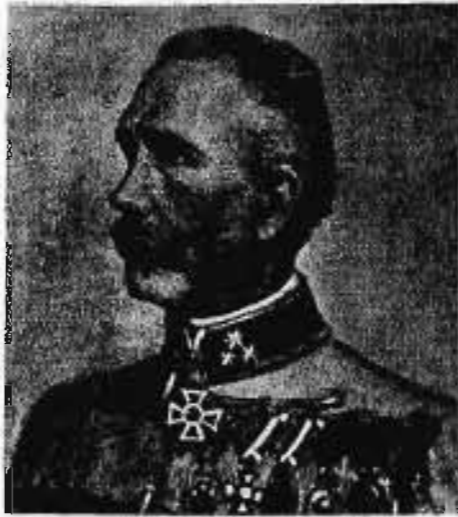
Murai és Köröstarcsai TÖRÖK FERENC altábornagy 1886. VII. 16—1897. VIII. 24.