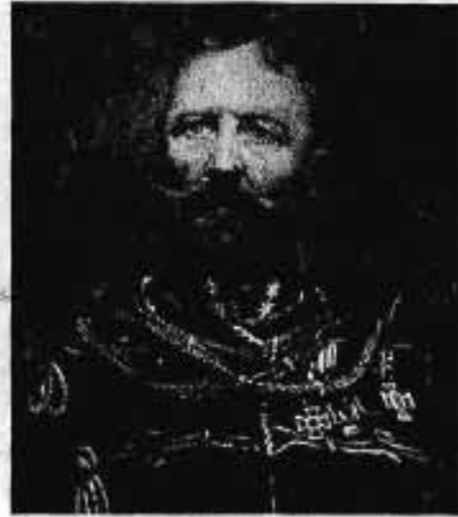
Szentgyörgyi JABLÁNCZY SÁNDOR altábornagy 1897. X. 21—1903. VIII. 3.