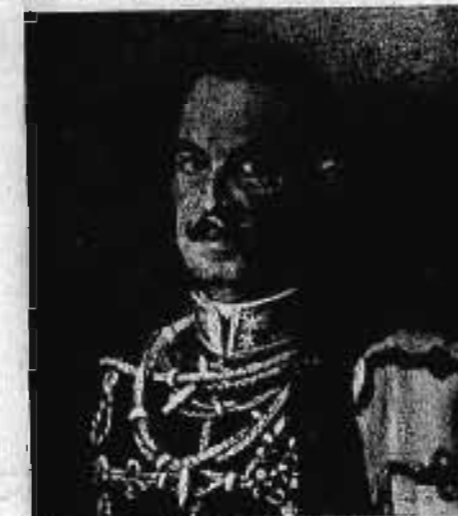
Keresztesi és adorjáni gróf CSÁKY ZSIGMOND altábornagy 1919. VIII. 21—1921. II. 20.