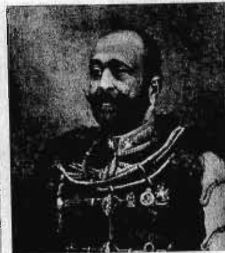
Altorjai ALTORJAY IMRE vezérőrnagy 1911. III. 7—1912. IX. 28.