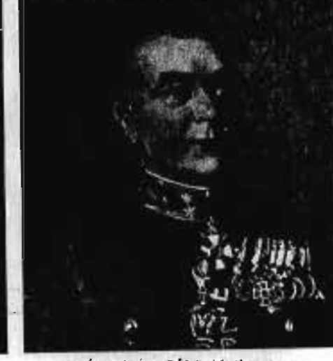
SZÁHLENDER BÉLA altábornagy 1923. IV. 1—1928. VI. 16.