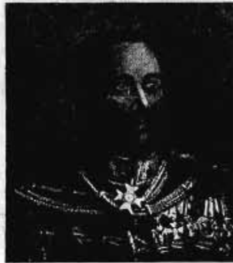
FERY OSZKÁR altábornagy 1917. X. 3—1919. VII. 21.