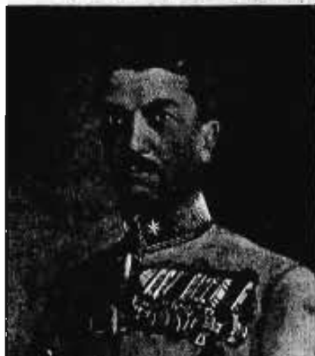
SCHILL FERENC vezérőrnagy 1928. VI. 28—1931. X. 6.