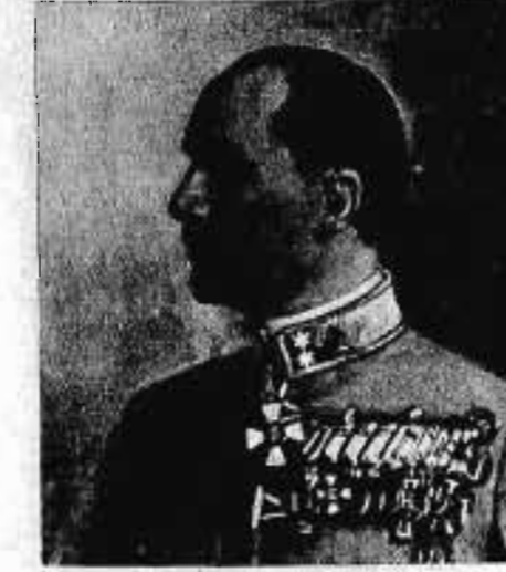
vitéz FALTA LÁSZLÓ altábornagy 1938. II. 1—1939. VIII. 1