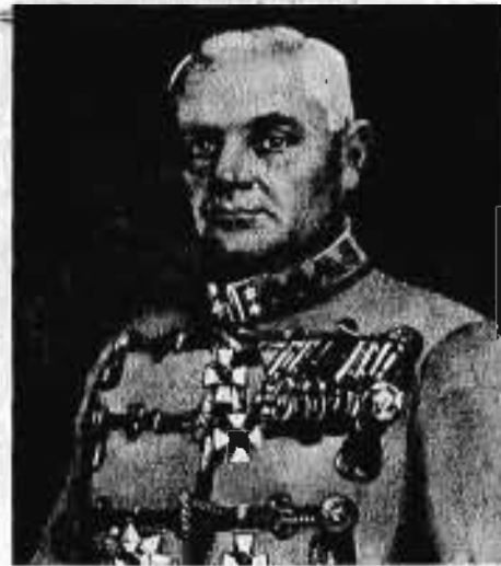
Folkusházy vitéz FOLKUSHÁZY LAJOS altábornagy 1936. VIII. 1—1938. II. 1.