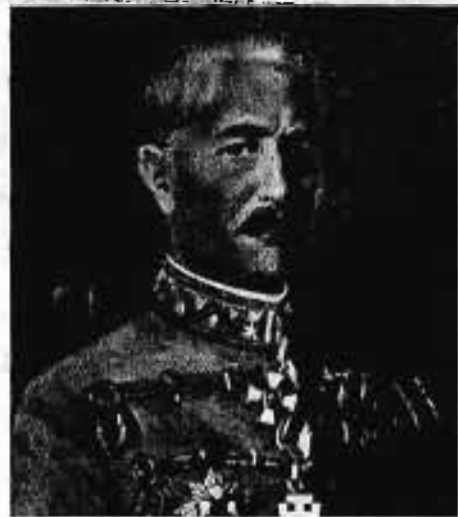
vitéz szinai SZINAY BÉLA altábornagy 1931. X. 6—1936. VIII. 1.