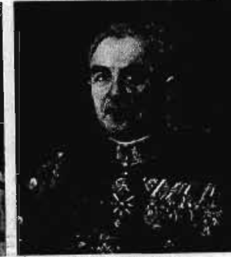
Körönyosi és bazódi KONTZ SÁNDOR altábornagy 1921. II. 20—1923. III. 31.