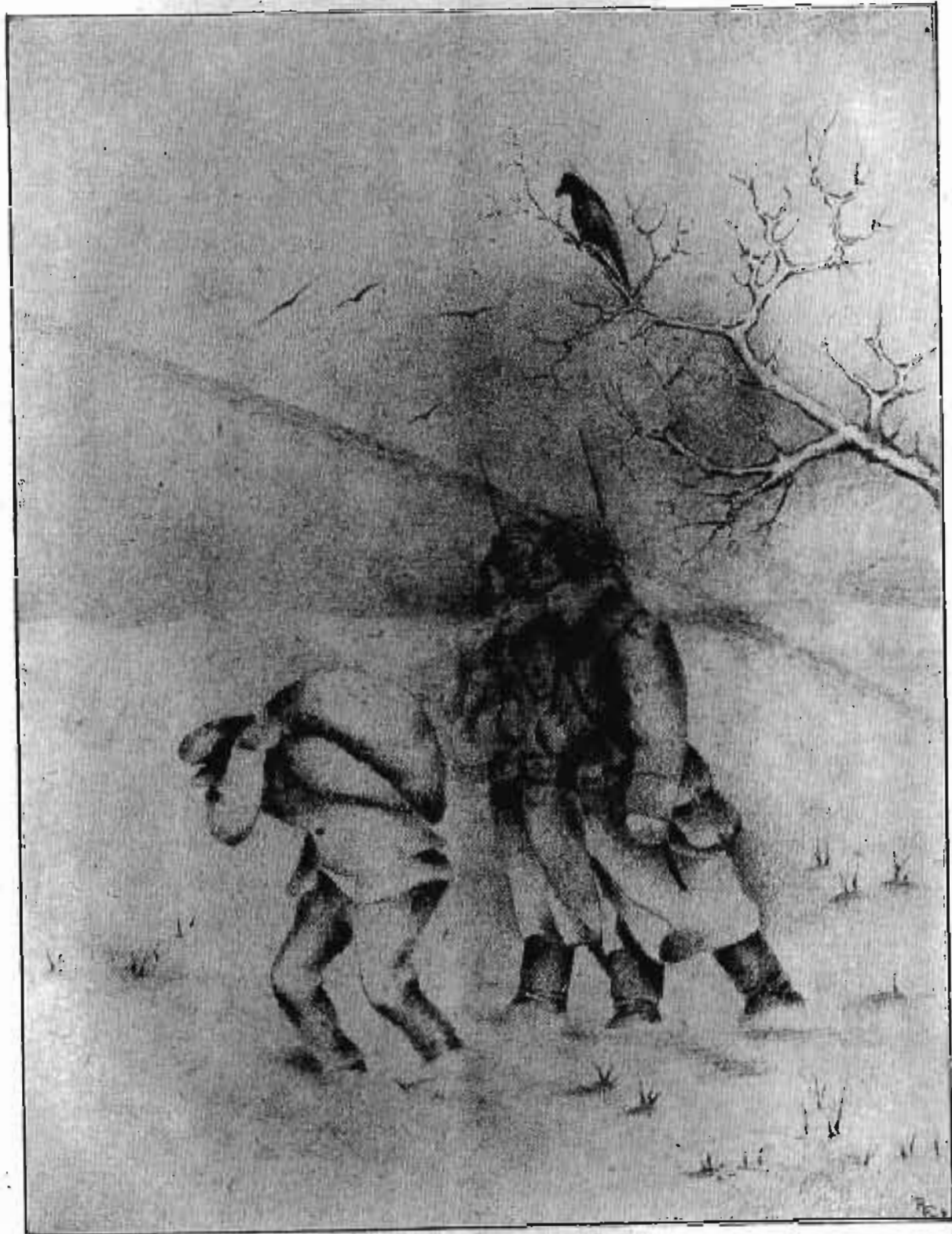
Ruttkay György rajza. (Kassa.)

Rövid, bizalmas alkudozás után megállapodtak abban, hogy a görbebotos jövő vasárnapra 500 darab