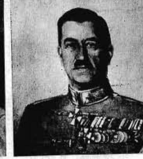
vitéz NEMEREY MÁRTON altábornagy 1939. VIII. 1—1942. XI. 15.