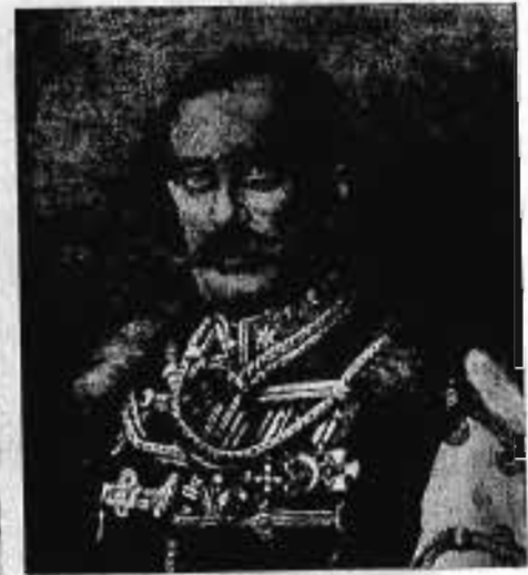
Postupiczi KOSTKA PÁL vezérőrnagy 1912. IX. 28—1913. IV. 14.