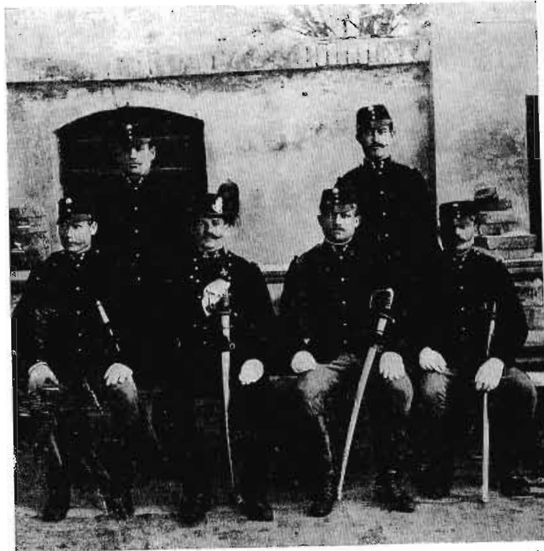
Egy csendőrsors a mult század végén.