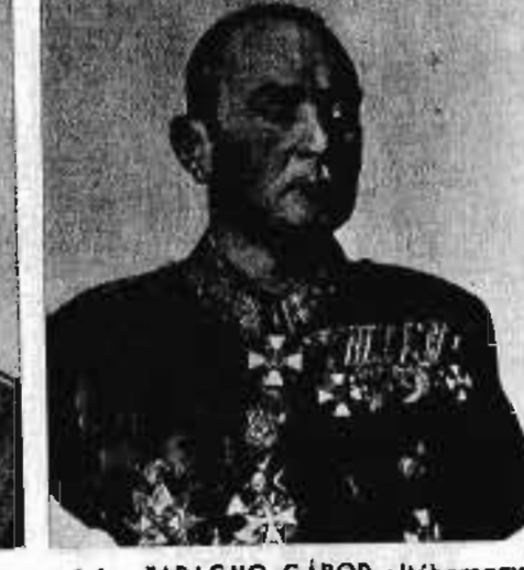
vitéz FARAGHO GÁBOR altábornagy 1943. XI. 15