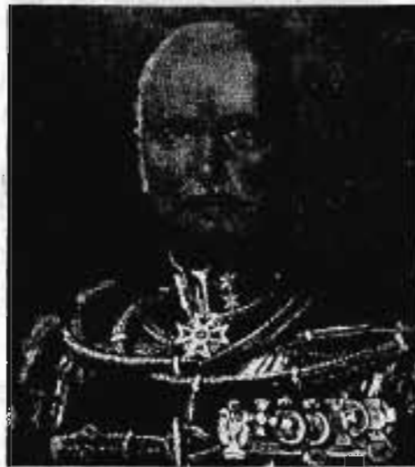
Tolcsvai NAGY GÁBOR altábornagy 1913. IV. 14—1917. X. 3.