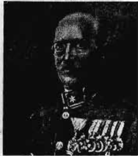
BARISS ÁRPÁD vezérőrnagy 1919. VIII. 10—1919. VIII. 20.