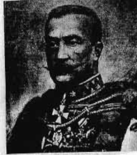
Sáromberki ZIEGLER KÁROLY vezérőrnagy 1908. V. 24—1911. III. 7.