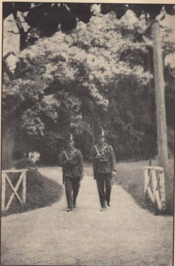
Kárpátaljáról: Járőr a szobránci fürdő parkjában.

Jó lesz erre ügyelni. Ma minden bokorban három nemzetmegváltó születik. Van köztük, aki tud, de nincs lelkiismerete, van lelkiismeretes, az viszont nem ért a dolgokhoz és van, akinek se tudása, se lelkiismerete. Mindent tagadnak, ami van, de hogy