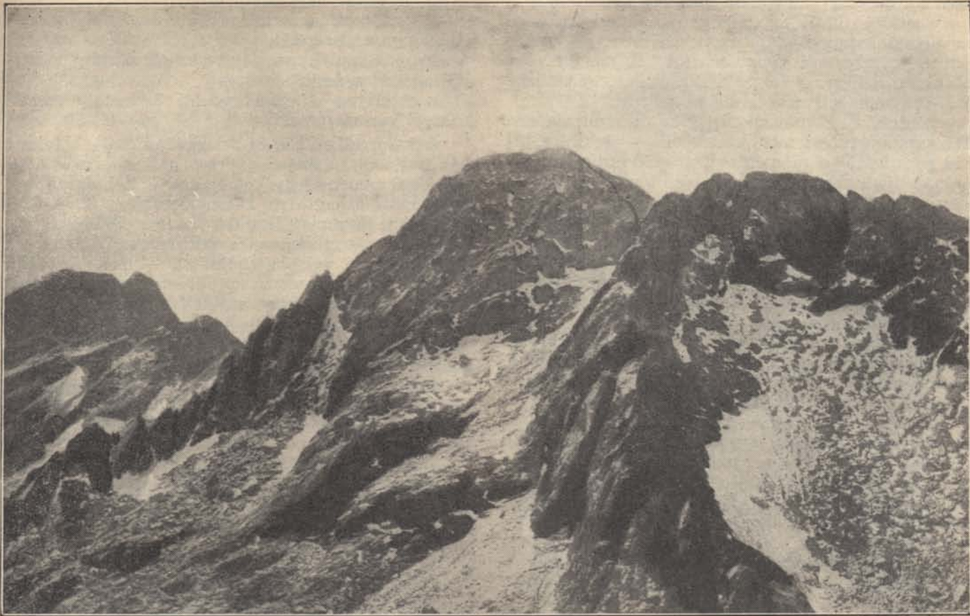
Erdélyből: a Negoi.

igénybevétele mellett utazik, akkor a katonadíjszabás szerű II. kocsiosztályú menetjegy árán felül az I. kocsiosztályban megtett útvonalra, aszerint, hogy gyors-, sebes-, vagy személyvonatot vett igénybe, annak a vonatnemnek megfelelő I. és II. kocsiosztályú polgári menetjegy ára közötti különbözetet meg kell fizetnie. Ilyen esetekben azonban pótdíjat a vasút nem róhat ki.