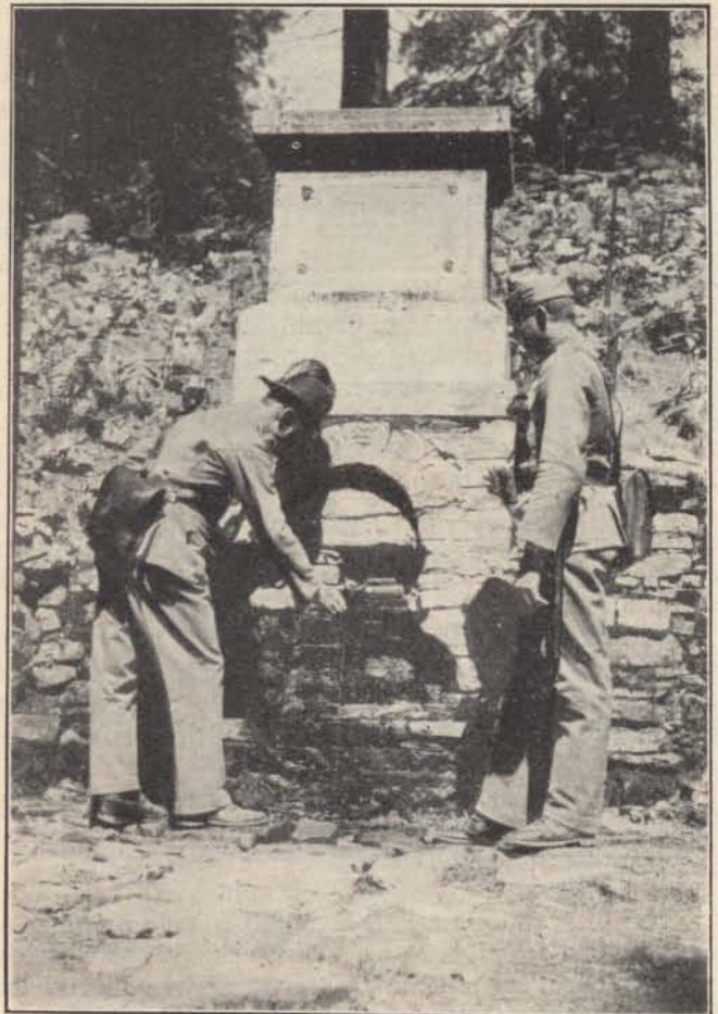
A Fekete Tisza forrásánál.

A pirománia: gyújtogatási téboly, a kiromantia pedig: kézből való jóslás.