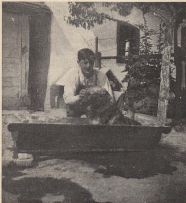
Mosakodás... (Galambos törm. v. — Szombathely — felv.)