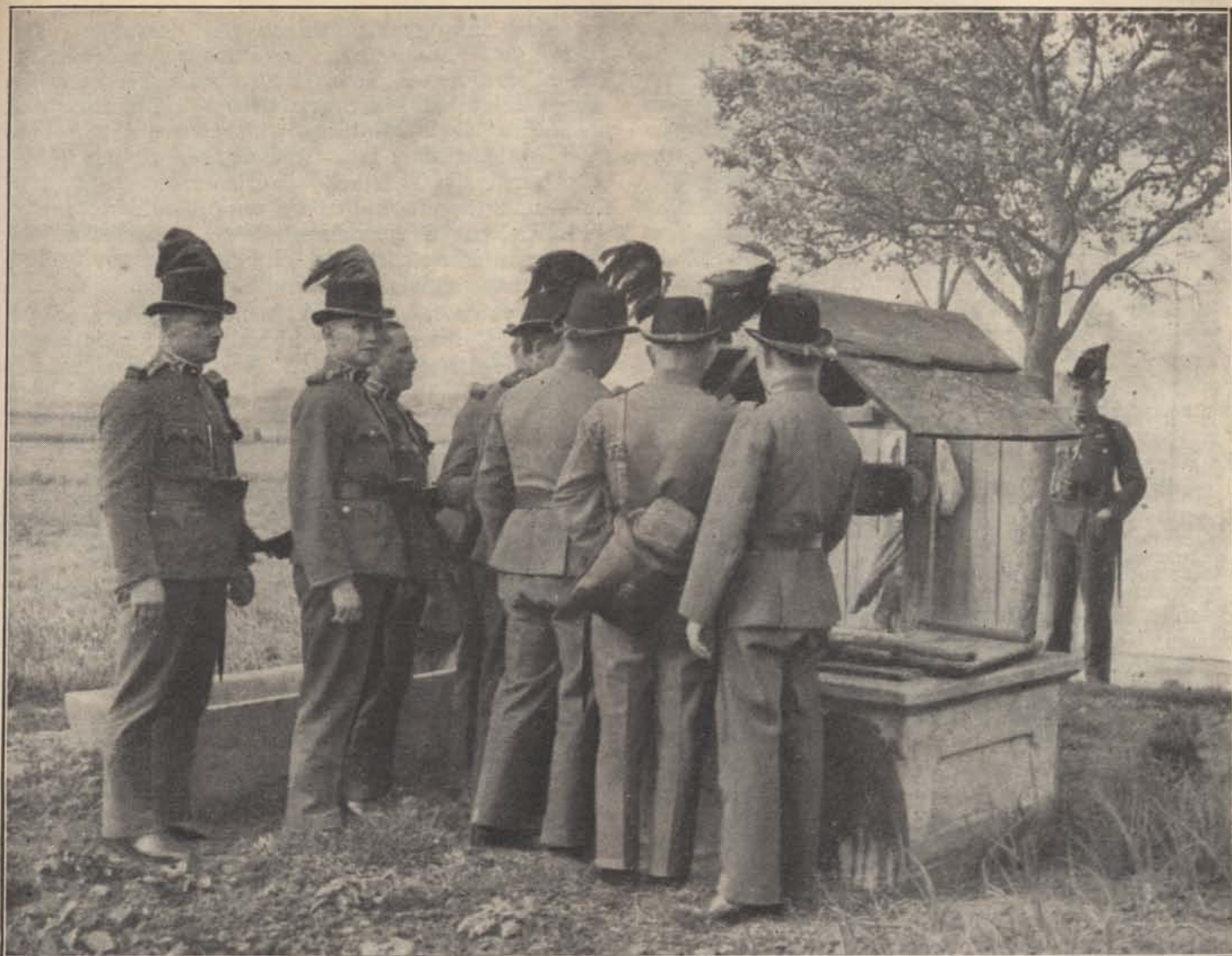
Bálint törm. v. felv.

ereje megmozgatta, megindította új munkákra, — de bizony rövidesen kifogyott és újra a régi rúgótlan bicska volt. Sok jószándékú csendőr sok erőködése veszett kárba ilyenképpen.