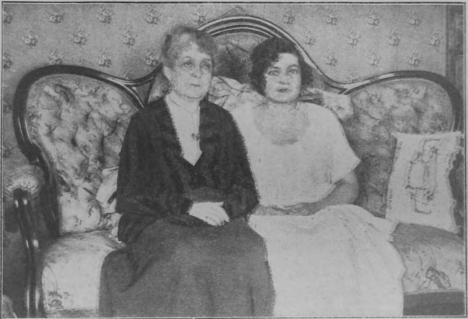
Blaha Lujza és unokája Blaha Gitta.

Utolsó felvétel, amely Blaha Lujzáról készült múlt év szeptemberében 75. születési évfordulóján.