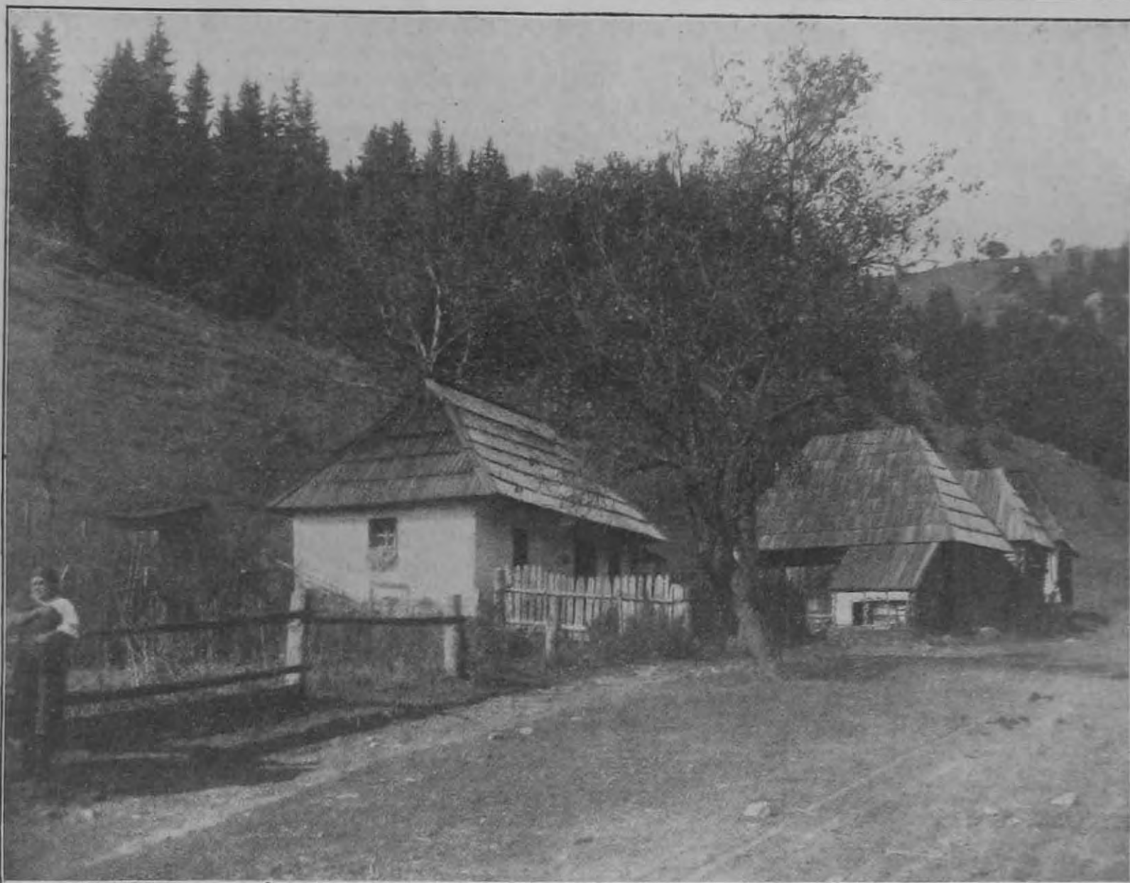
Amit vissza kell szereznünk. Gyimesi kép.