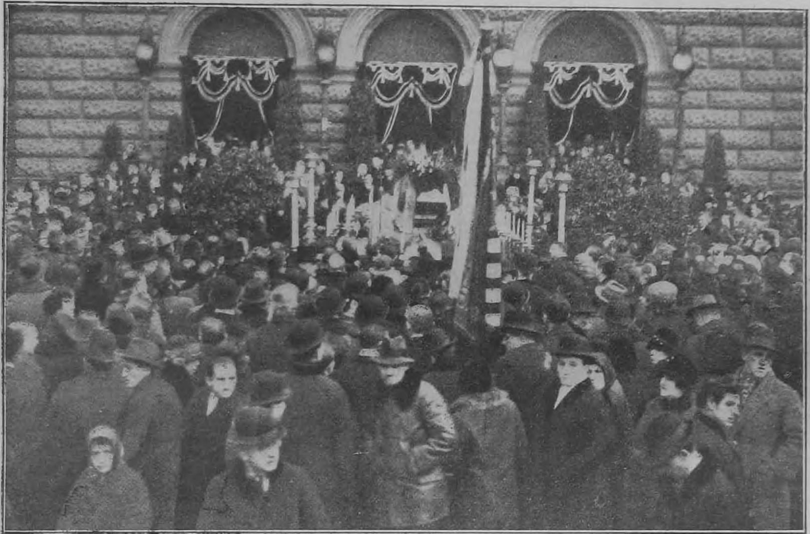
Blaža Lujza ravatala a Nemzeti Színház előcsarnokában.

gyobb arányú kivétel az ország gazdasági helyzetét nemzetközi viszonylatban is megjavítja . . . Lám, egy egyszerű májusi eső, mennyi betekintést enged az emberek gondolkodásmódjába.