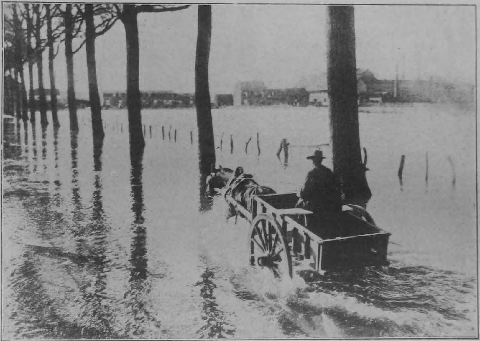
Hollandiában is pusztított az árvíz.

7. A juryben minden testületből, melyhez a résztvevők tartoznak, egy tiszt, illetve tisztviselő vagy legalább 8 középiskolát végzett egyén vesz részt. A versenyrendszer egyöntetű kiépítése és a leendő bírói gárda egyöntetű nevelése végett a jury elnöke ez idén minden versenynél és vizsgánál a csendőr kutyatelep parancsnoka lesz.