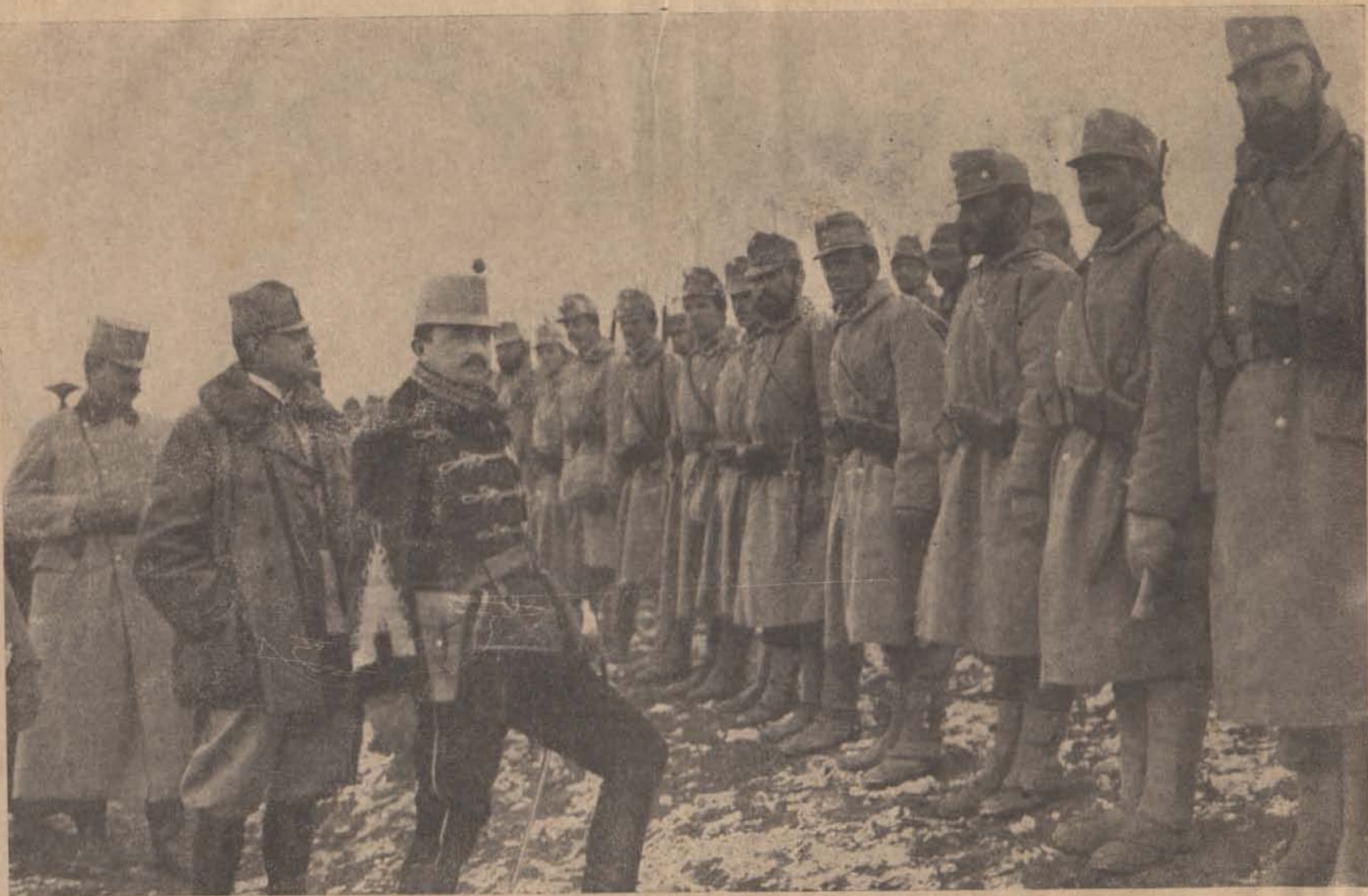
Károly király magyar népfelkelőkkel beszélget.