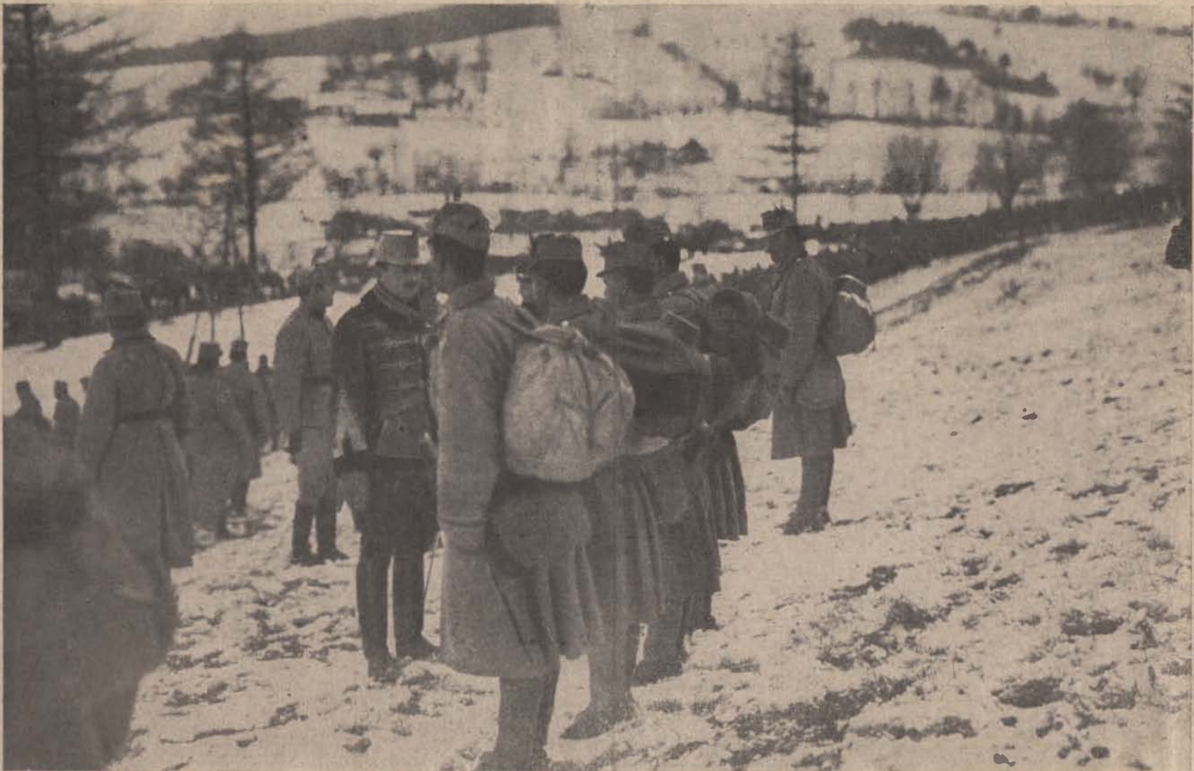
Károly király a magyar bakák közt.