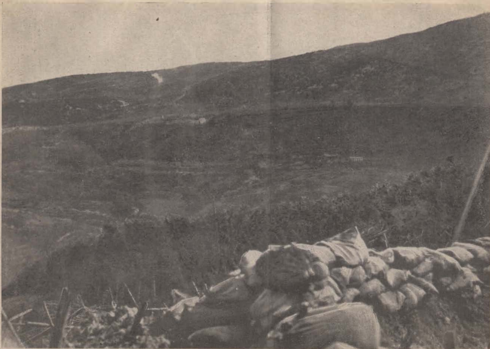
Az olasz harcztérről — A Sabottino Oslavjáról nézve.