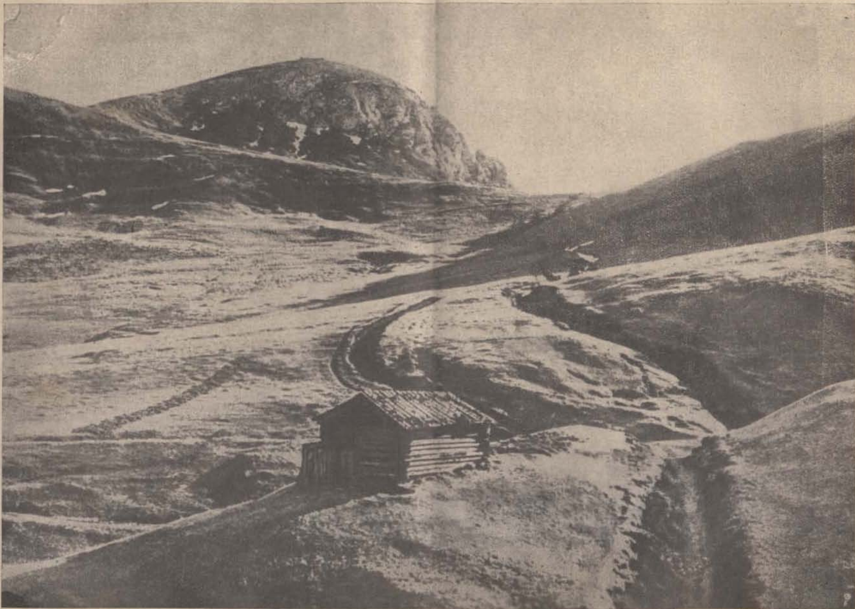
A déltiroli harezok színhelyéről. — A Col di Lana vidéke.