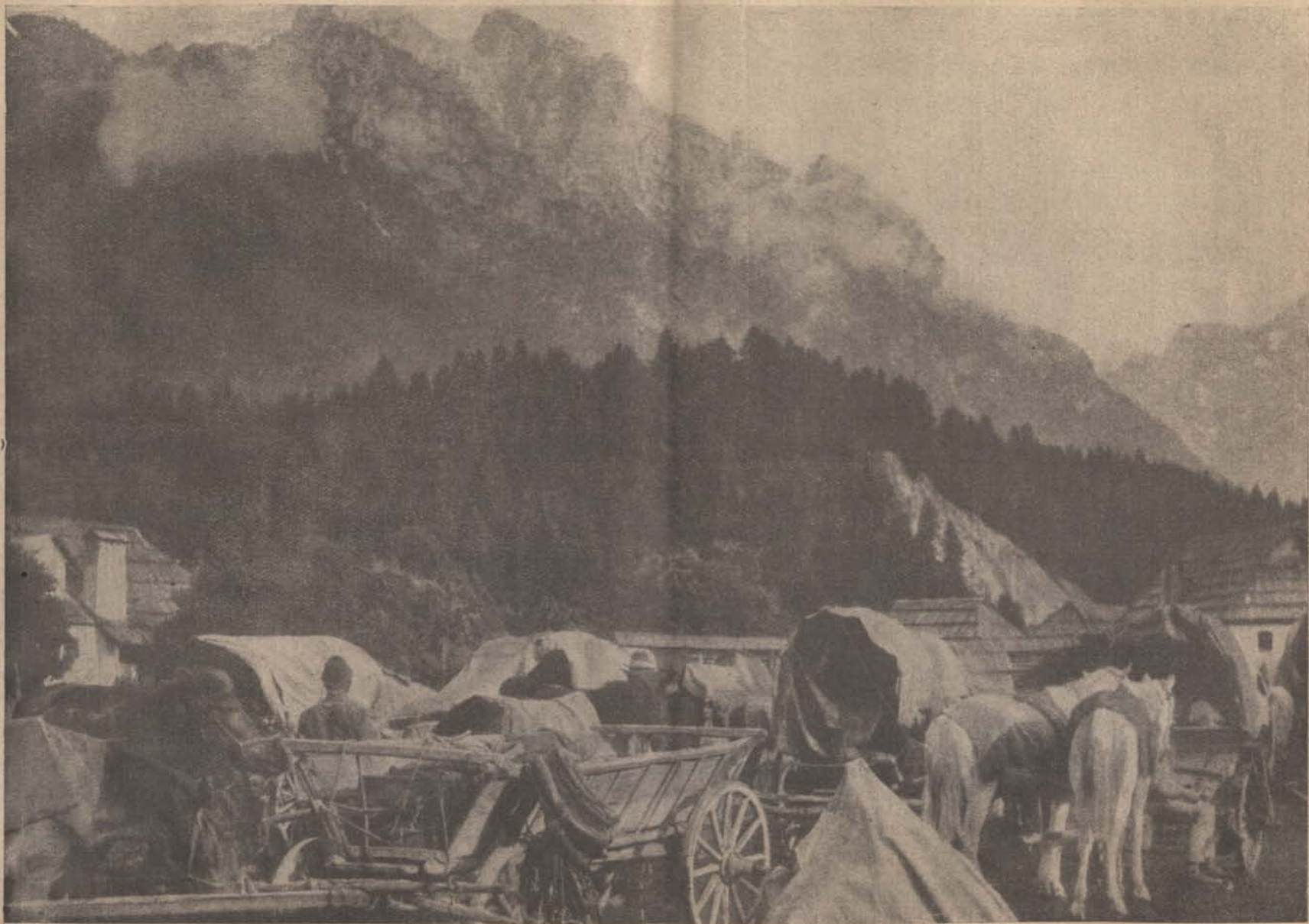
A déltiroli harcok színhelyéről — Szállító katonák egy hadtáp-állomásor.