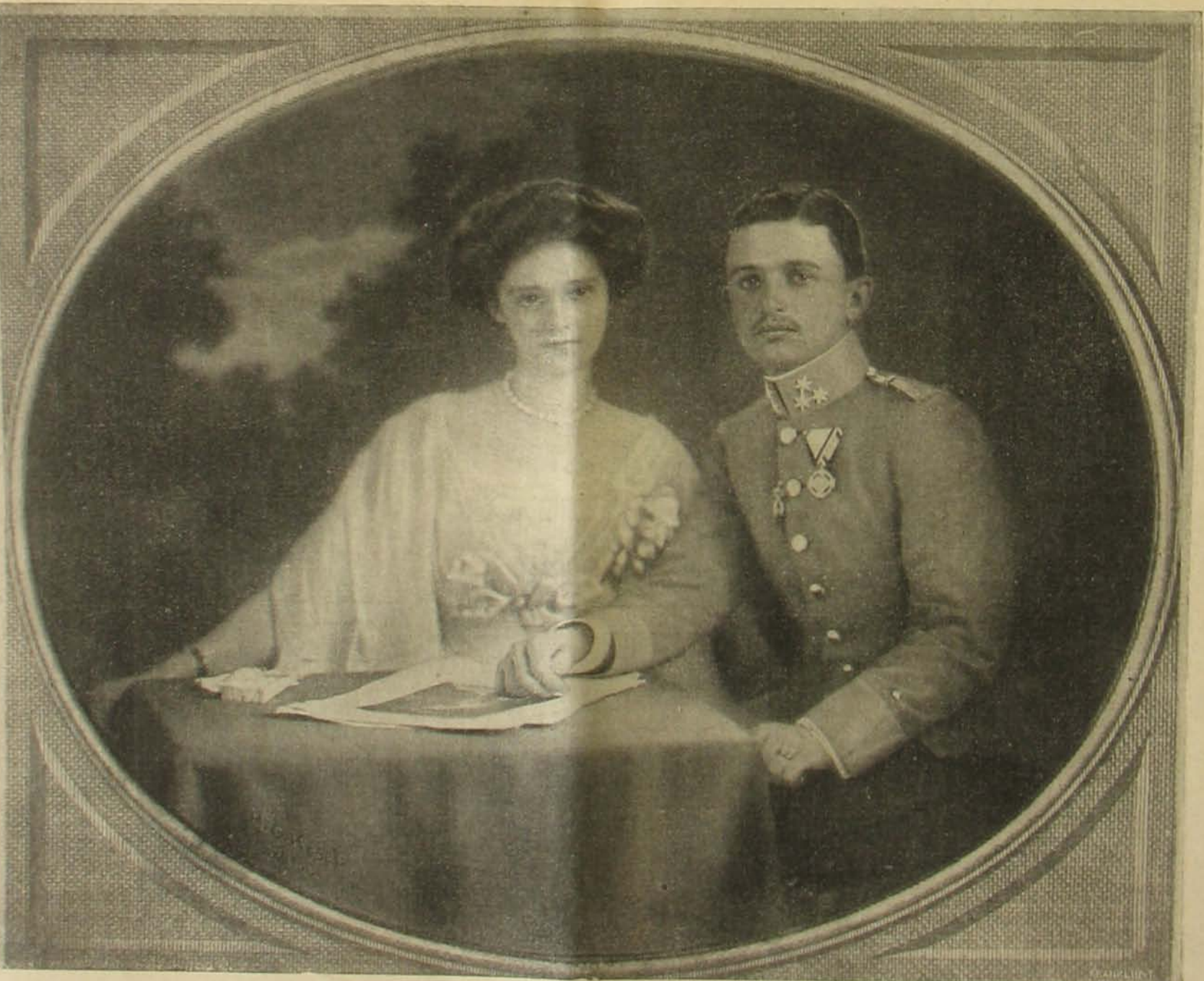
Károly Ferencz József főherczeg és Ifjú nejje, Zita párnul herczegnő.