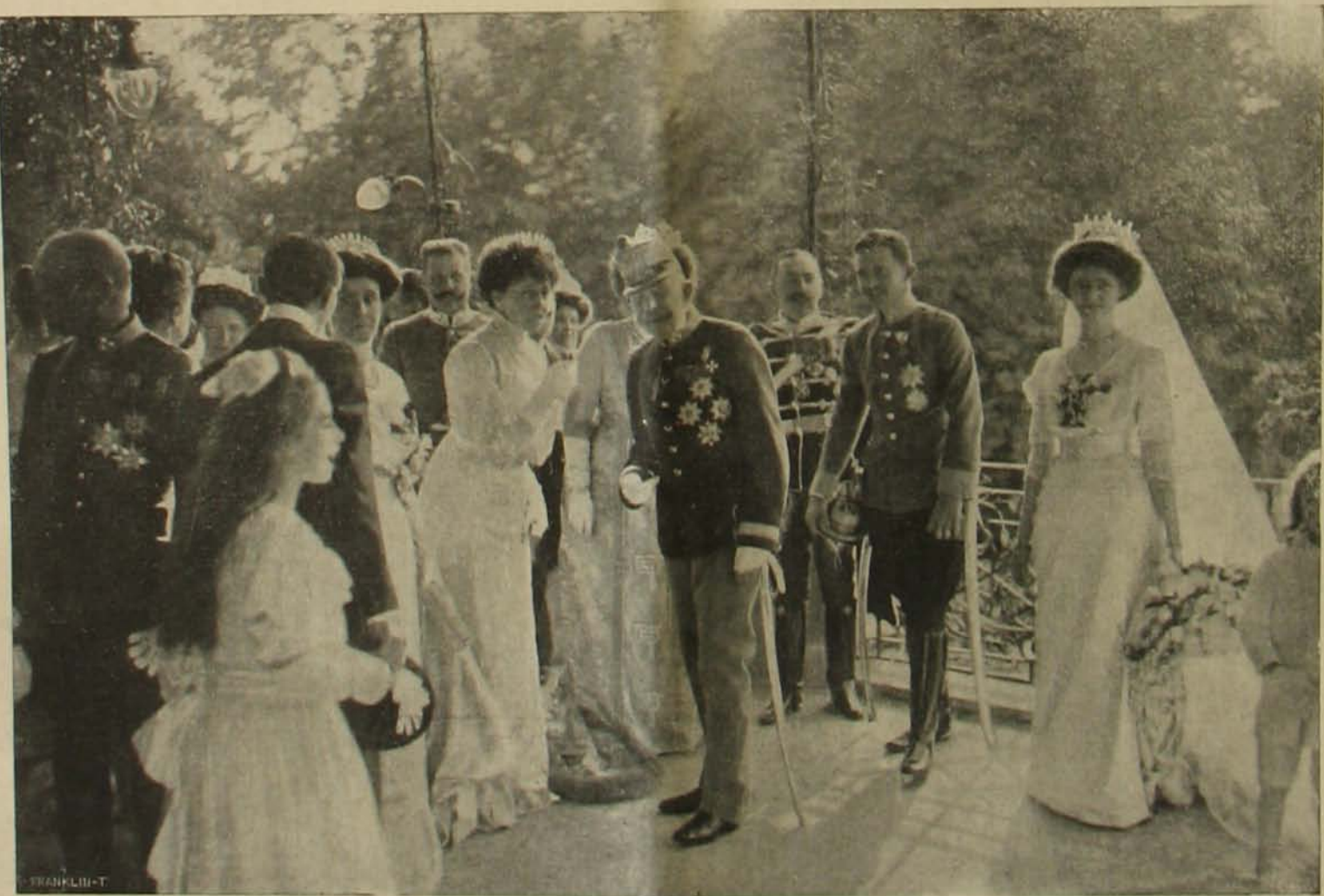
(Jobbról balra: Zita hercegnő, Károly Ferencz József főherceg, a király. Mária Antonia párnai hercegnő, a menyasszony anyja, mögötte Ferencz Ferdinánd trónörökös.)

Károly Ferencz József főherceg és Zita párnai hercegnő esküvője Schwarzauban.