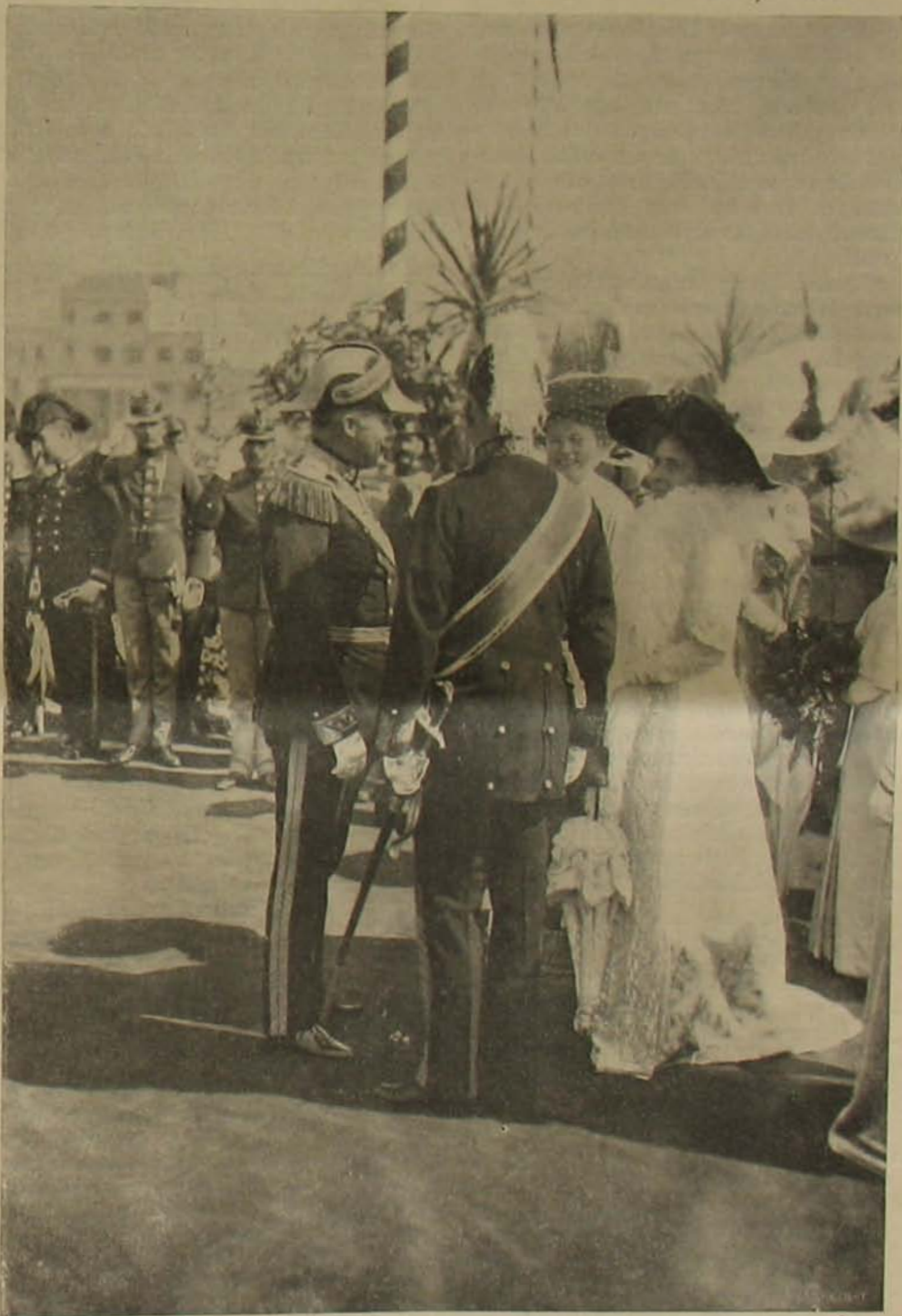
Ferencz Ferdinánd trónörökös és neje Hohenberg hercegnő az ünnepélyen.

A „Viribus Unitis”, az első Osztrák-Magyar dreadnought típusú csatahajó vízrebocsátása Triesztben.