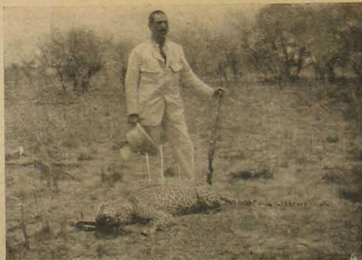
Juszuf Chamel basa, egyiptomi herceg, párduczával.