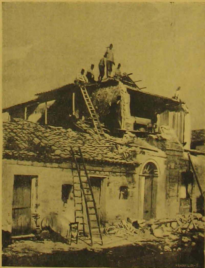
Katonák bontják a beomlással fenyegető falakat.