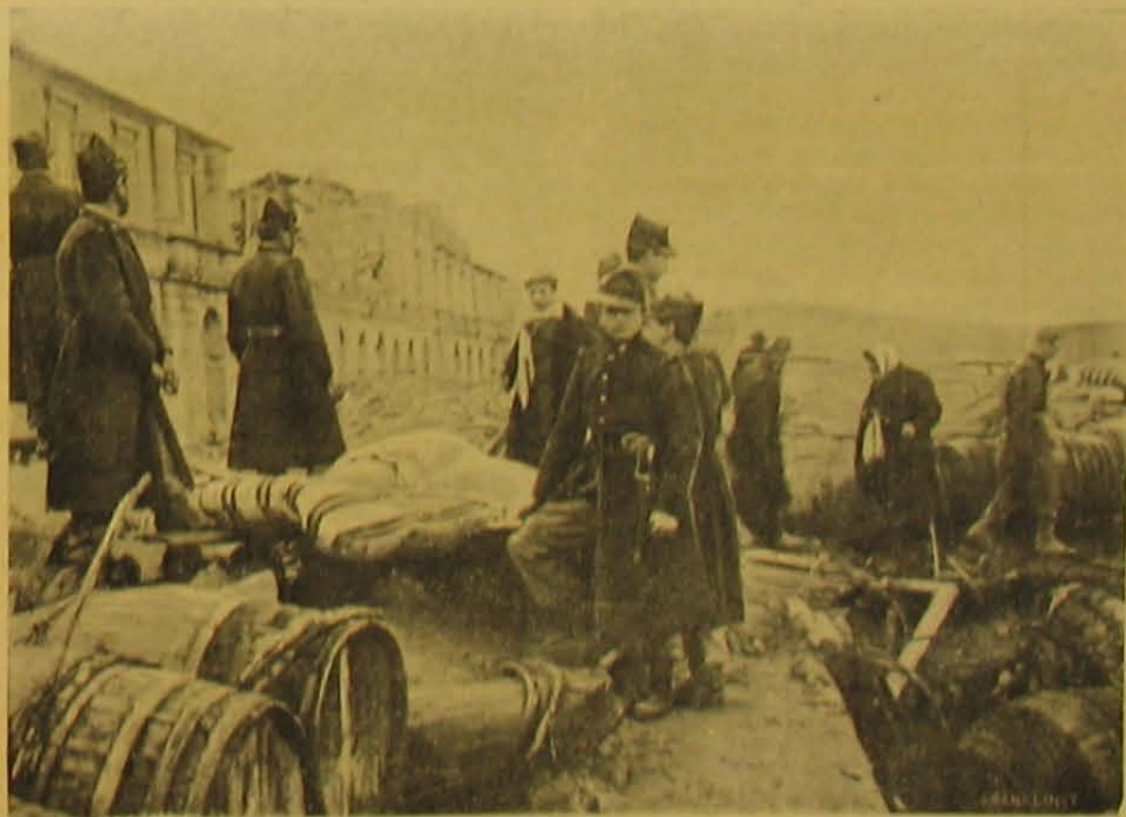
Holttesteket szállító katonák Moszcovában.