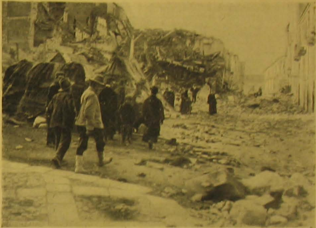
Messina üzleti városrésze a katasztrófa után.