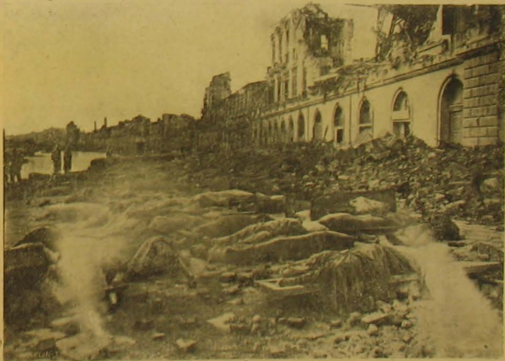
Holttestek az utózán Messinában.