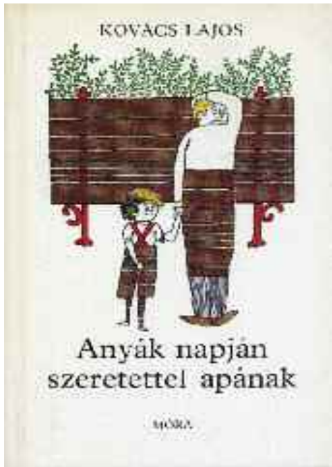
Könyvek az életműből