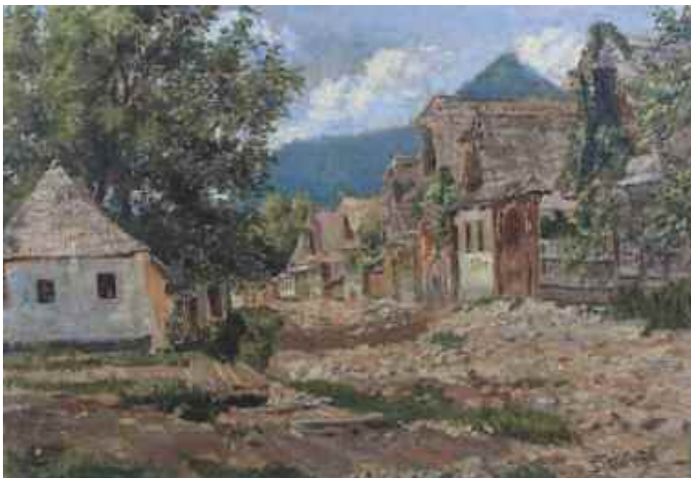
Streitmann Antal: Felsőbányai utca , 1904