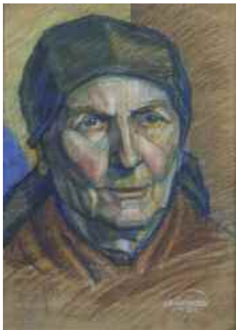
Szirmai Albert: Idős asszony portréja , 1922