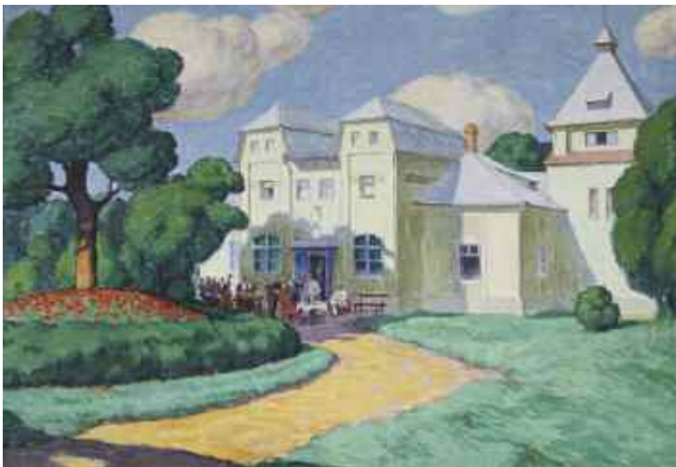
Pechán József: Az úr mulat - Zobnatica , 1912