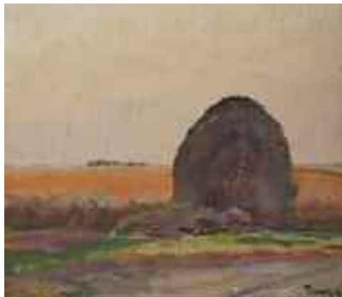
Tornyai János: Boglya, 1909