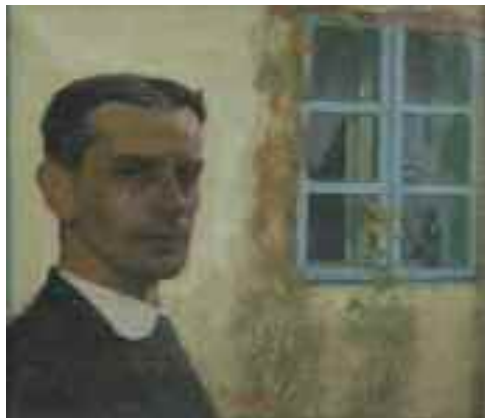
Oláh Sándor: Őnarckép, 1911