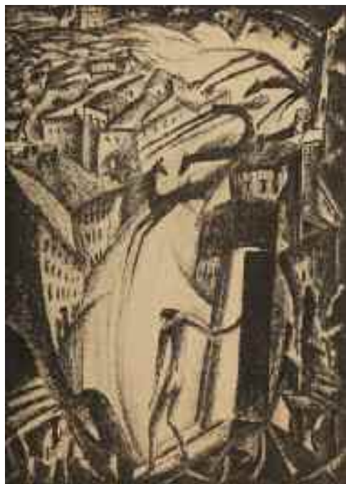
Balázs G. Árpád: A halál lovai , 1926