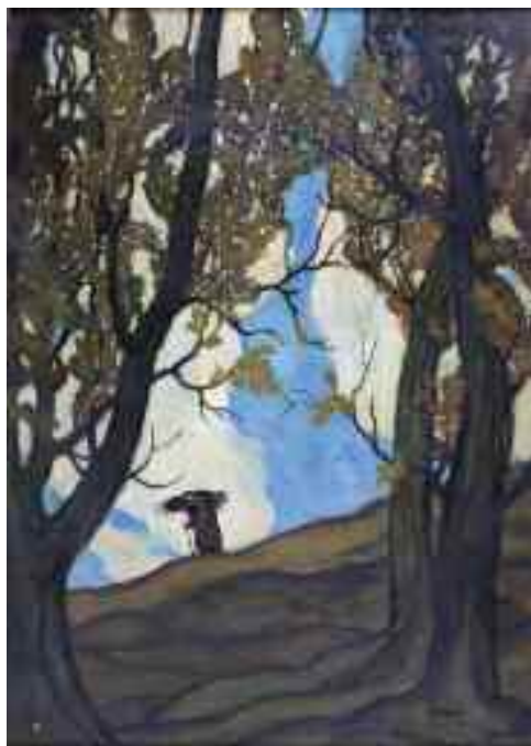
Farkas Béla: Rőzsehordó , 1930