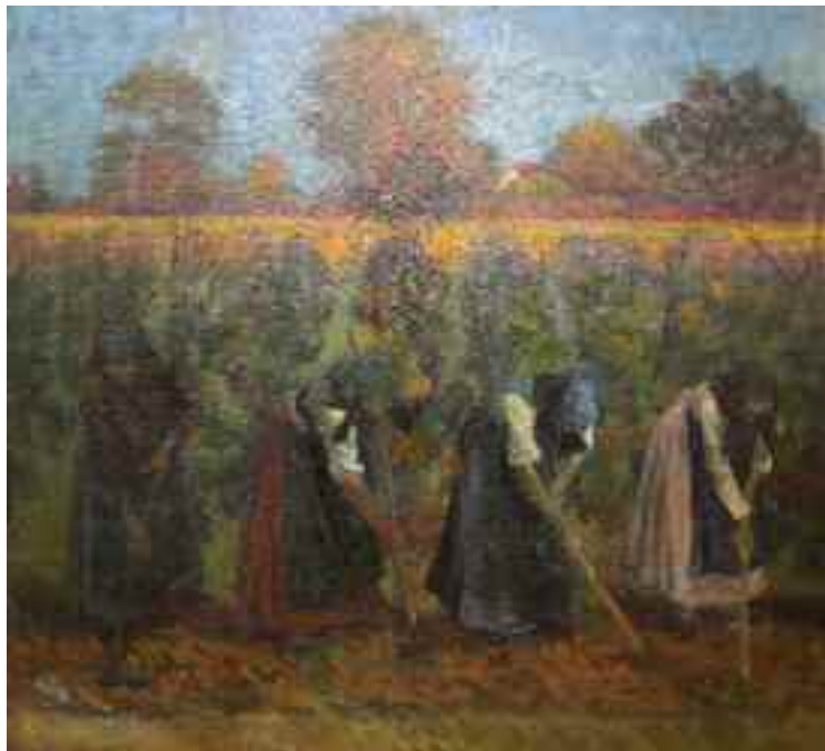
Kernstok Károly: Szőlőkapálás, 1906

Béla (2002-ben), Baranyi Károly és Farkas Béla (2004-ben), Bicskei Péter (2005-ben), Eisenhut Ferenc (2007-ben), Nagypáti Kukac Péter (2008-ban). 8