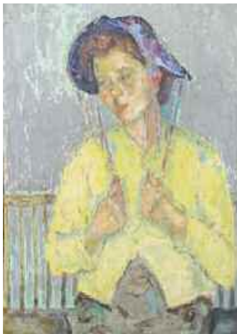
Demeter Erzsébet: Sárga kabátos nő , 1929