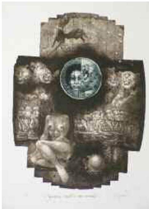
Magasra száll a sasmadár, 1989

mit viselnek a darabban, és rendszerint az elégedetlenségük rajtam csattant. Nagyon örültem, hogy végre belejöttem, amikor ismét közbeszólt a sors és másfelé irányított.