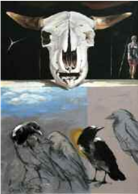
Bikakoponya varjakkal és egy hölgygel, 2010.