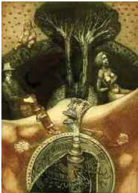
Nyugalom völgye, 1988