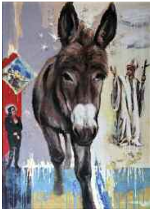
Apokrif szentjeink, 2002/11