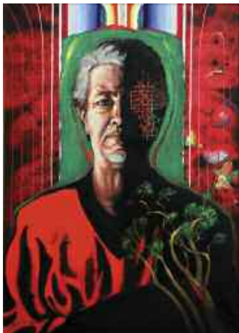
Fényben-Árnyékban (Önarckép), 2005