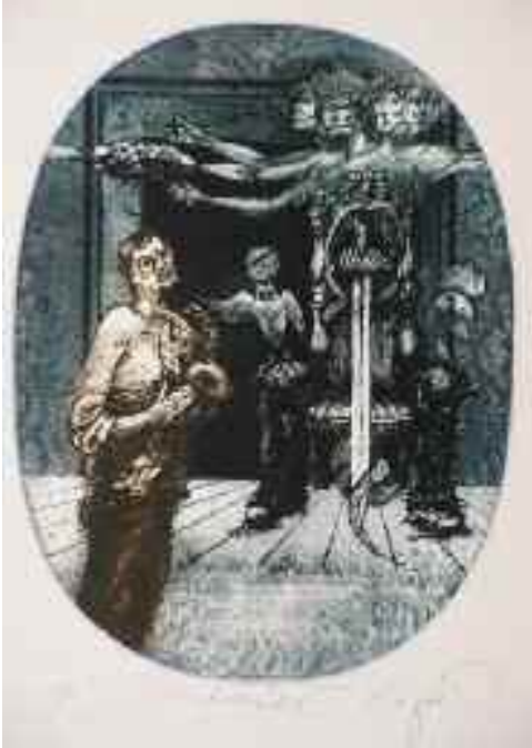
Hamletia I, 1989