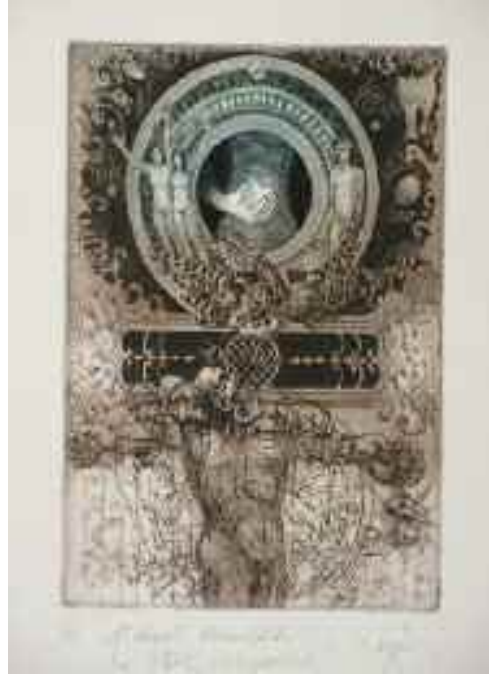
Ha jöttök, csöngessetek, 1990