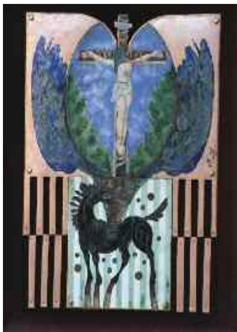
Ime a Nő (Csallóközi golgota), 1996

ezért lemondott a tisztségről és engem győzködött arról, hogy vállaljam el a feladatot. Erre csak úgy voltam hajlandó, ha teljesen új alapokra helyezük a szervezetet és új névvel vágunk bele. 2014 nyarán alapítottuk meg a MAMSzE-t mintegy 40 taggal. A rendteremtés sikeres volt, a tagság nyilvántartása előírászerű, mindenki fizeti a tagdíjat, és a szlovákiai képzőművészeti szövetségtől is megkapjuk a támogatást. Rendszeresen szervezünk kiállításokat, Zentán, Szabadkán, Brüsszelben és Nagyváradon is bemutatkoztunk. Állandó kapcsolatban vagyunk a magyarországi és a Kárpát-medence