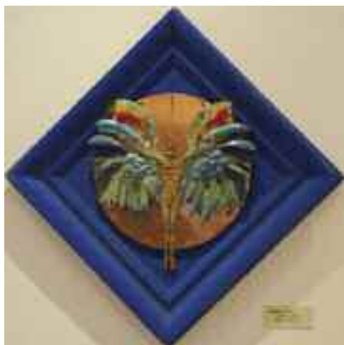
Madárember I., 1997