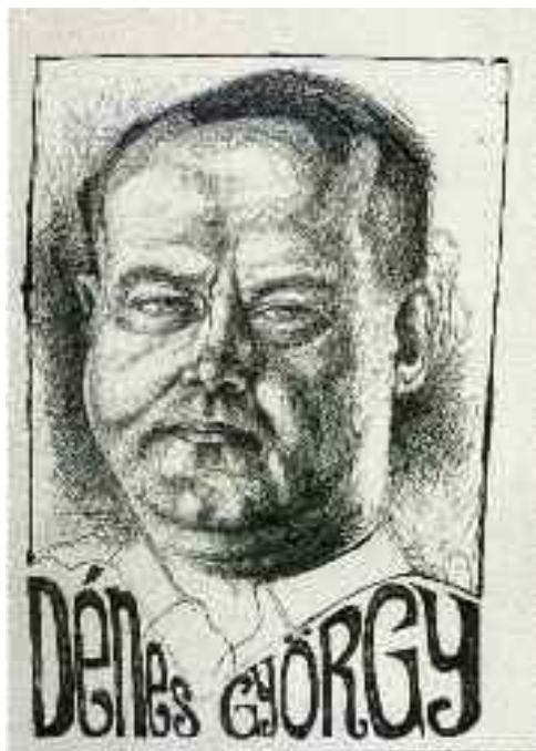
Dénes György költő (1923–2007)