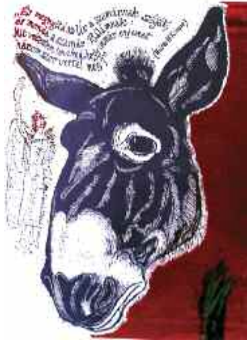
Bálám szamara, 2004 (Festményfotók: Nagy Tivadar)

arról a legfontosabb dologról, amely éltet és ilyen jó erőben megtartott eddig?