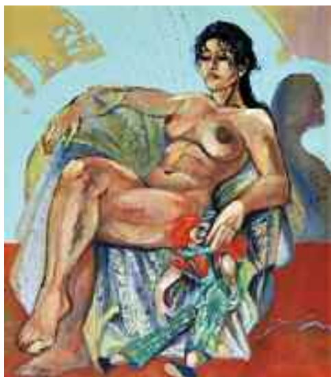
Akt fotelben, 1999