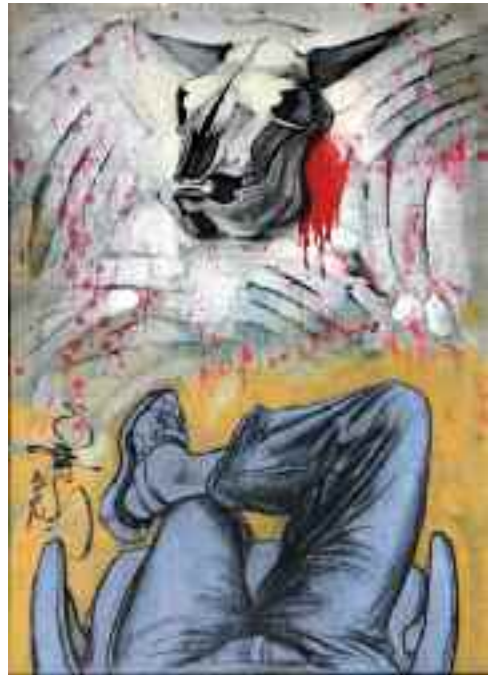
Ihletre várva, 2002