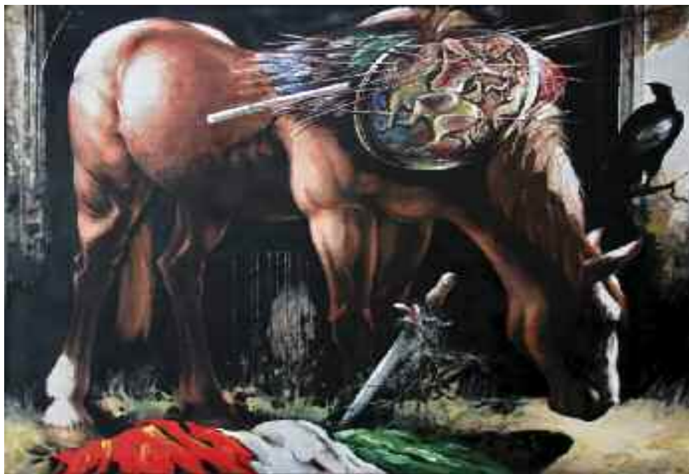
A Ló (Bulcsú horka emlékére), 2012/14