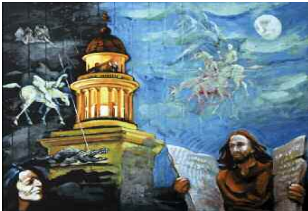
György lovag kalandja holdfényben a pannonhalmi Apátság körül, 2009