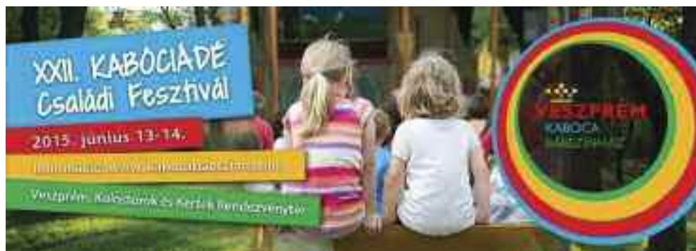
Kabóciádé, Veszprém, 2015