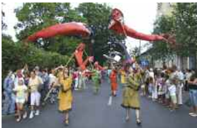
A Szárnyas Sárkány Fesztivál utcai felvonulása