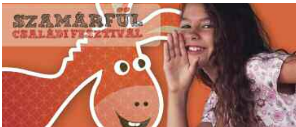
Szamárfül Családi Fesztivál, Pécs