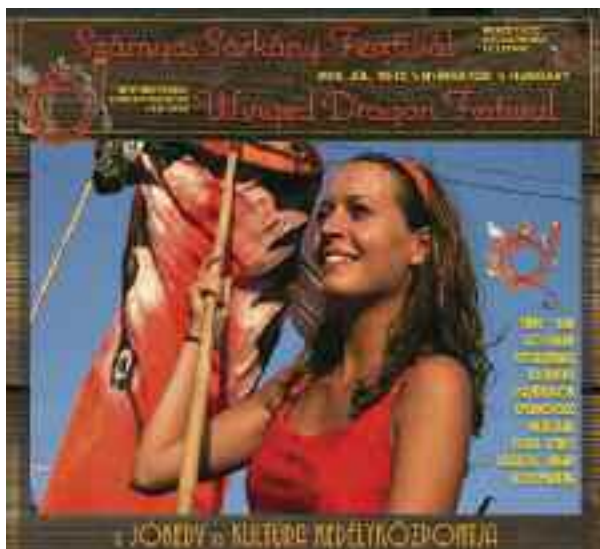
Szárnyas Sárkány Fesztivál, Nyírbátor, 2015