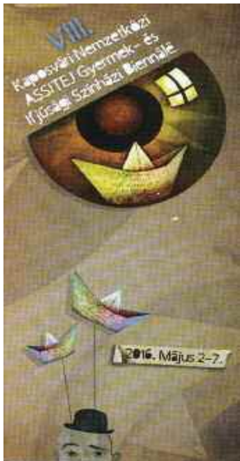
Gyermek- és Ifjúsági Színházi Biennálé, Kaposvár, 2016