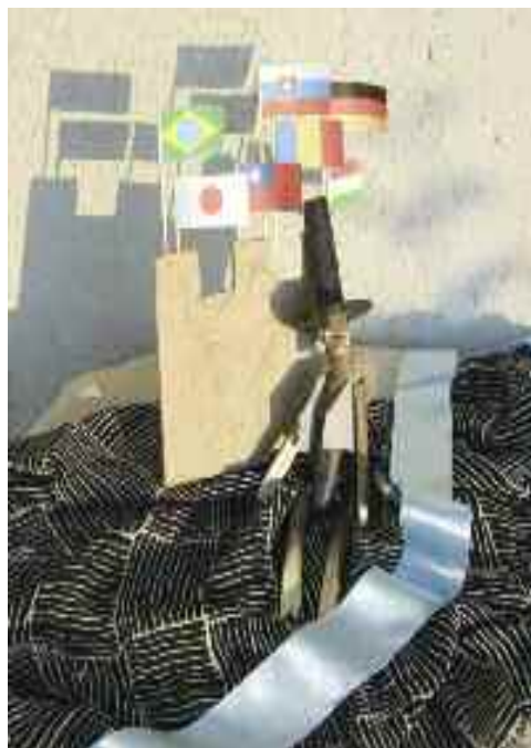
Zsákomban a bábot, Sárospatak, 2003