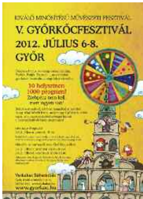
Győrkőcfesztivál, Győr, 2012