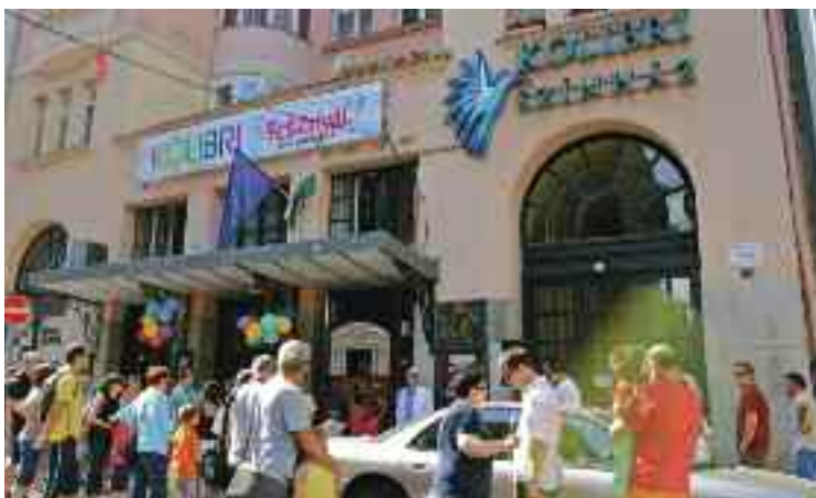
Kolibri Fesztivál, Budapest, 2016