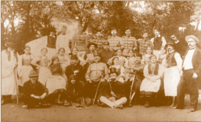
A Piros bugyelláris szereplőgárdája 1913-ban

A tűzoltók aktív szerepet vállaltak a település különböző társadalmi eseményeiben: felvonultak, és díszőrséget álltak fogadásokon, egyházi és egyesületi ünnepélyeken, sőt még színészként is megállták a helyüket. A testület megalakulásának 10. évfordulója alkalmából a tagok a dunakeszi műkedvelőkkel színjátszó csoportot alakítottak, és a község háza tanácstermében előadták Csepreghy Ferenc Piros bugyelláris című népszínművét. Az előadást három alkalommal ismételték meg nagy sikerrel, mely a testületnek több mint kétezer korona tiszta jövedelmet hozott. Az esemény fontosságát jelzi, hogy az Ország-Világ képes újság egyoldalas tudósításban számolt be a történetekről.