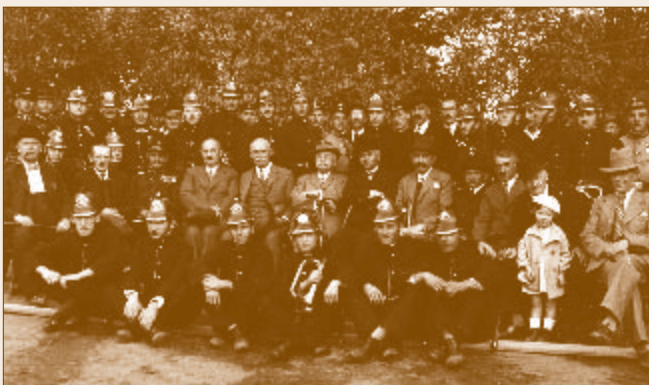
Az Alagi Önkéntes Tűzoltó Egyesület, középen a település vezetői