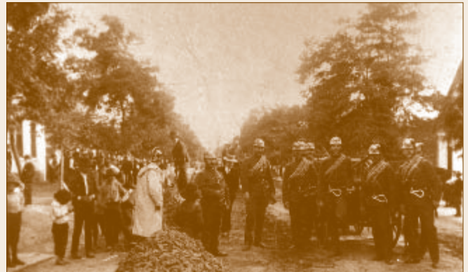
A dunakeszi tűzoltótestület tagjai segédkeznek a Fő út kövezésénél

A pécelihez hasonló tűzoltóversenyeket viszonylag gyakran rendeztek, s ezeken a testületek igyekeztek ott lenni, hisz a találkozók a szakmai ismeretek elsajátítását is elősegítették. A dunakeszi tűzoltók országosan is kiemelkedő eredményekre voltak képesek, amelyre jó példa az 1911. évi országos versenyen elért hatodik, a megyei versenyen elért első, valamint az 1915-ös megyei és az 1933-as járási versenyen megszerzett első helyezésük.