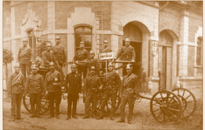
A dunakeszi tűzoltók megyei verseny győztes csapata a község házi szertár előtt 1911-ben