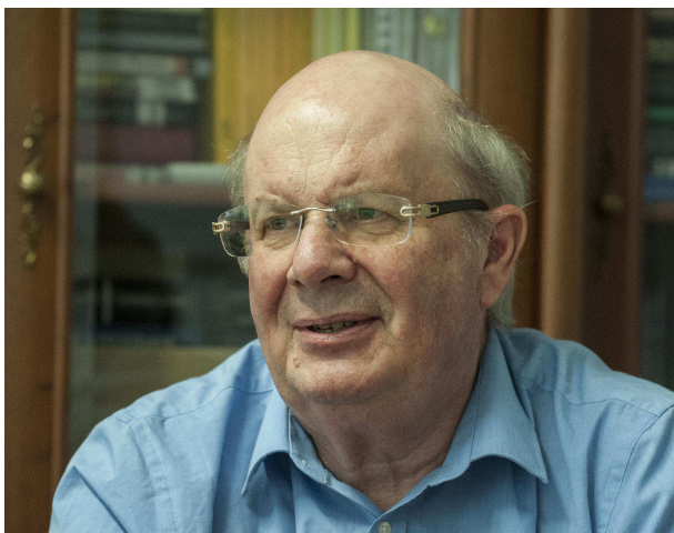
Timothy Jull

Nem kellett sokáig beszélgetnünk, hogy rájöjjenek, mindehhez nem annyira hollywoodi vagányságra volt szükség, mint inkább némi nyitottságra és egy különleges izotópra, melynek neve szén-14.