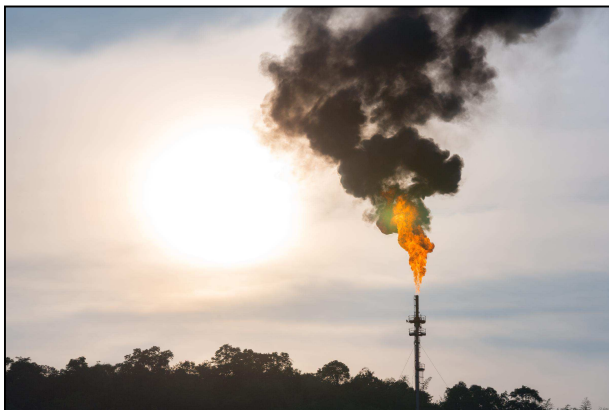
Olajfinomító fáklyája – az ősi fosszilis lerakatok egyáltalán nem tartalmaznak szén-14-et

légkör az 1950-es években hirtelen „megfiatalodott”, azóta viszont gyors ütemben „öregedik”.