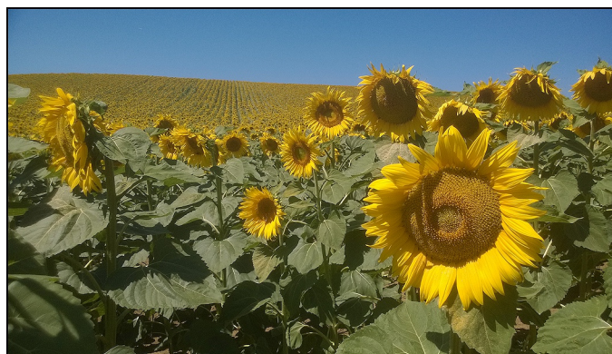
Gyönyörű napraforgók Tinnye határában, ameddig a szem ellát

A régi házakat, présházakat lebontották, átalakították, modern új lakóházakat építenek, a család szükségleteit üzletek