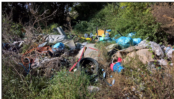
Illegális szemétkuckó a Kutyahegy tövében

orgona sötét lila virágaival pompázik, kicsit kanyarogva Tinnye felé veszi az irányt. Balra szinte végig gyönyörködhetünk a panorámában, jobbra pedig egy vadregényes hasadék kísér. A szemfüles sétáló a bokrok alján vad fokhagymást is találhat.