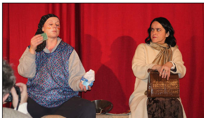
A Buszmegálló c. jelenet előadása a tinnyei művelődési házban