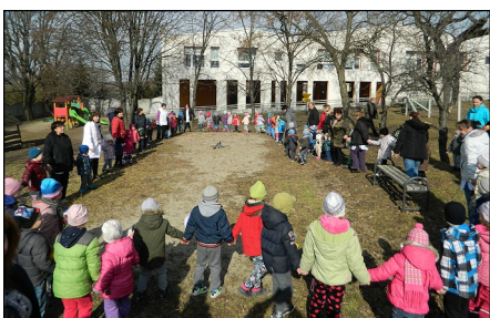
"Vesszen a tél, jöjjön a tavasz!"

Hangos énekekkel, mondókákkal, rigmusokkal, kereplőkkel, csengőkkel, kolompokkal, úztük el a hideget, annak minden búját-baját. Közös körjátékkal, énekekkel. „Vesszen a tél, jöjjön a tavasz!”