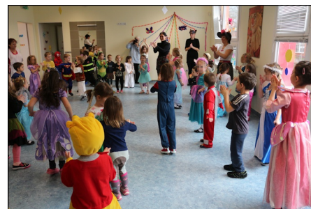
Farsang a tinnyei oviban