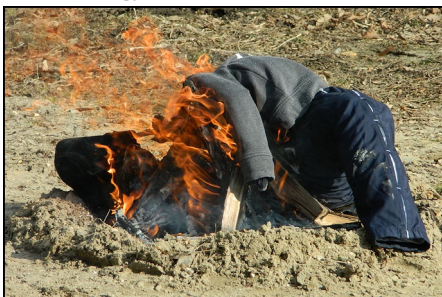
A kiszebáb égetése

A tinnyei ovisok és a felnőttek új hagyományteremtő programmal készültek a tél temetéséhez. Kiszebáb égetésével búcsúztatták a telet az óvoda udvarán a bölcsisekkel és az érdeklődő szülőkkel együtt.