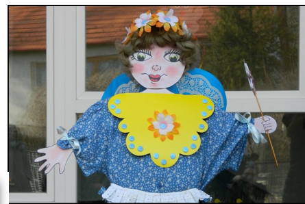
Tavaszi Tündér

közös kántálásával, úztünk ki minden „rosszat”, majd behoztuk a Tavasz Tündért, aki meleggel, vidámsággal, egészséggel köszöntött ránk.