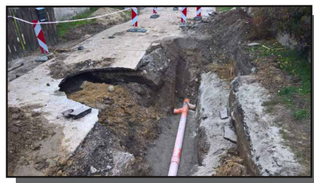
A helyzet néhány nap múlva

Lehet, hogy az építkezéseknél annak idején sokszor nem volt megfelelő az