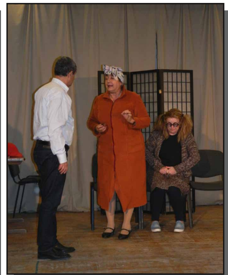
Folynak a próbák a Kossuth Lajos Művelődési Házban