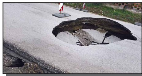
Petőfi Sándor utca, 2016. október 13.