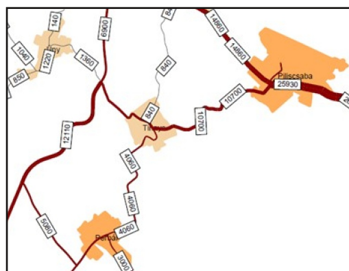
Nyugati nyomvonal Tinnyénél