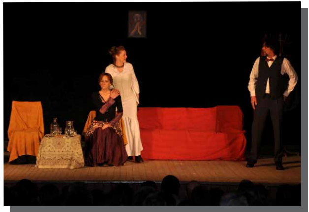
Csehov: Leánykérés (előadás), 2011.