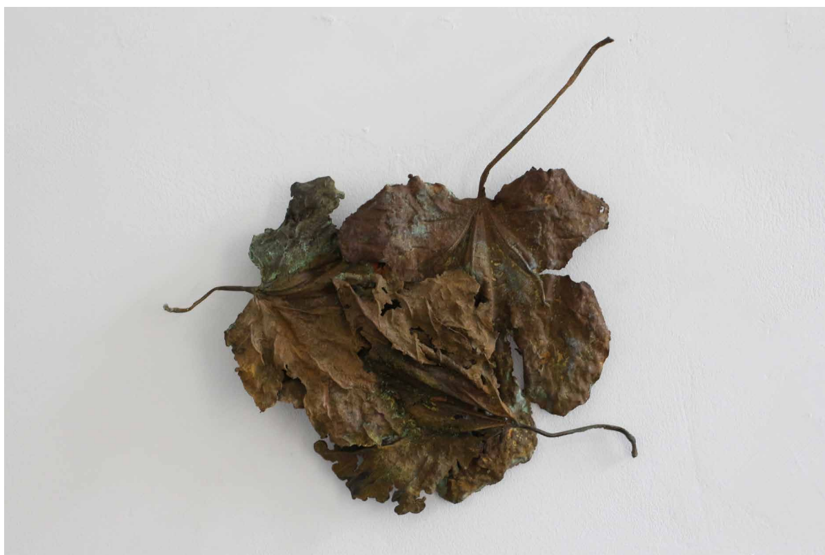
Füge, 2018 bronz, 27 × 25 × 2 cm

Budapest Galéria | 1036 Budapest, Lajos utca 158.