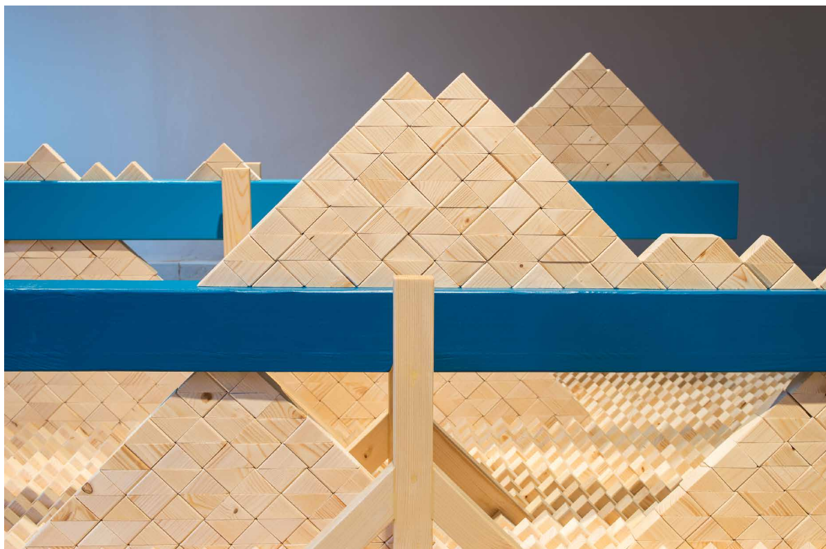
Zéró összegű játék, 2020 akril, fa, 250 × 250 × 90 cm