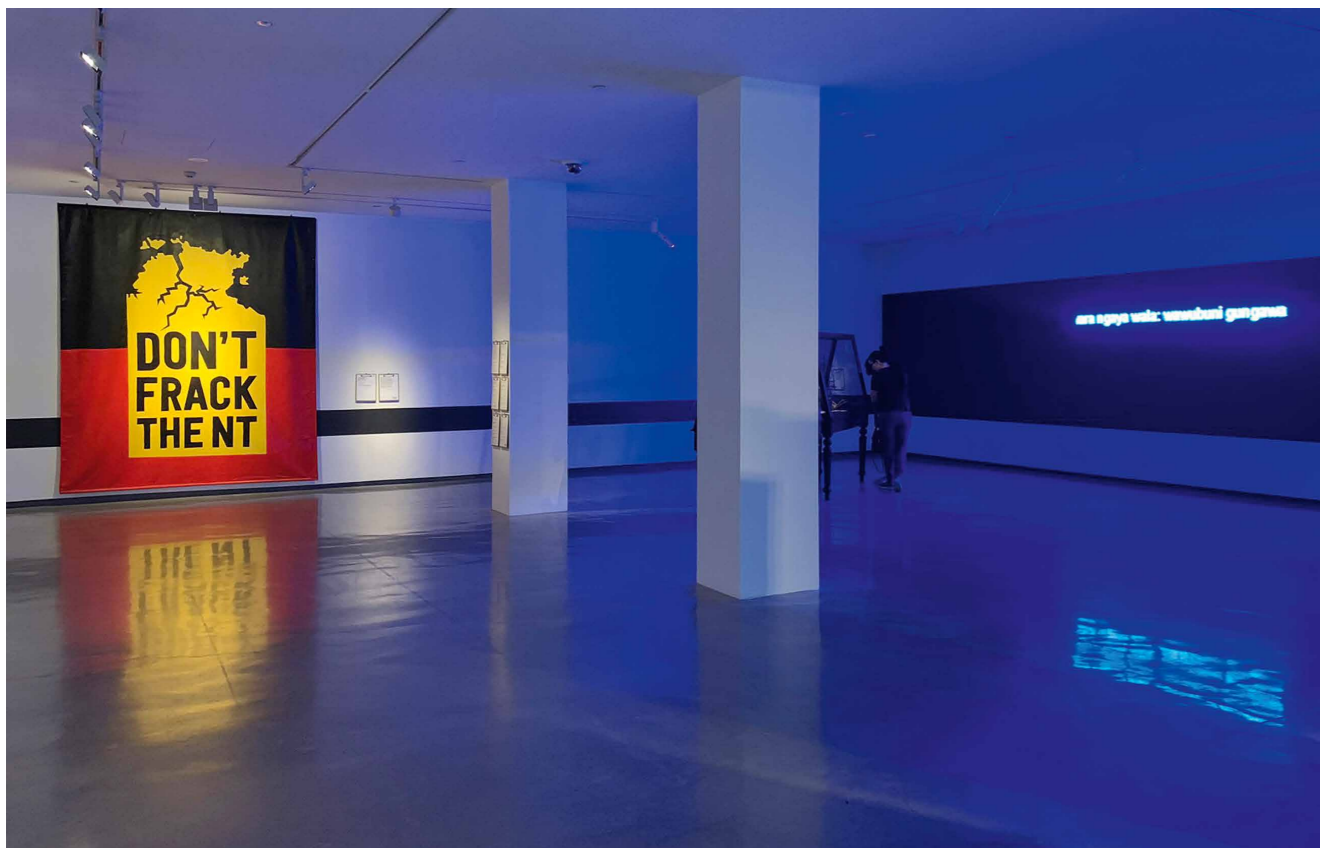
TONY ALBERT Ne törd össze az NT-t , 2020, falfesték, zászló; helyszín: Ausztrál Kortárs Művészeti Múzeum

munkája különösen mellbevágó. Igen, 2015-ös alkotás: a fotó kint volt már márciusban is, amikor eredetileg nyílt a biennálé. Megnyílt, de a Covid-19 járvány miatt hozott óvintézkedések miatt szinte azonnal be is zárt.