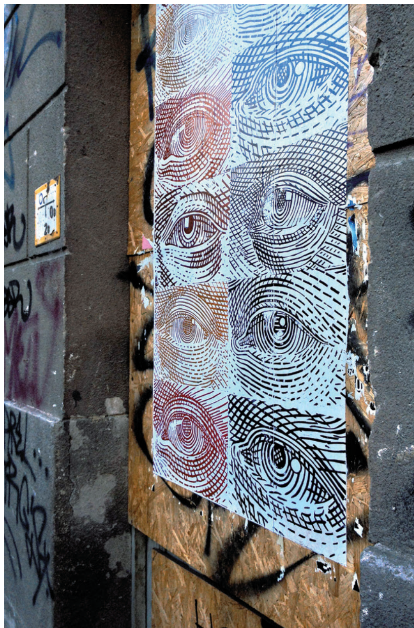
A legtöbb – az FKSE hagyományőrző éves kiállítása, 2014, Budapest | FARKAS ROLAND (épület homlokzatok)