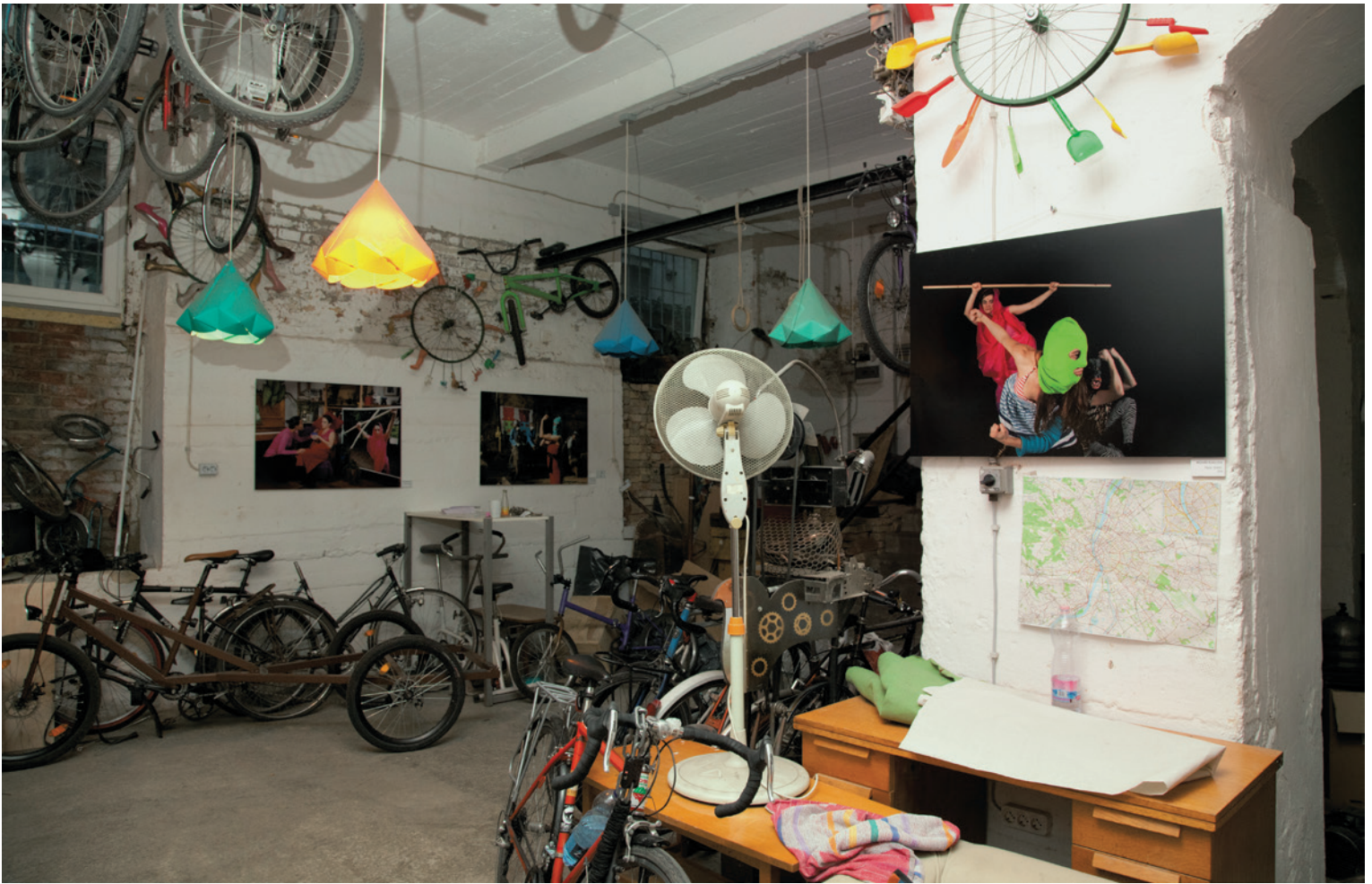
A legtöbb – az FKSE hagyományörző éves kiállítása, 2014, Budapest | MOLNÁR ÁGNES ÉVA (Cyclonomia)