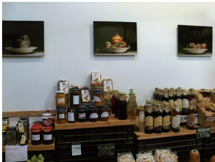
A legtöbb – az FKSE hagyományörző éves kiállítása, 2014, Budapest | CZENE MÁRTA (Lumen Zöldség és Közösségi Szolgáltató)