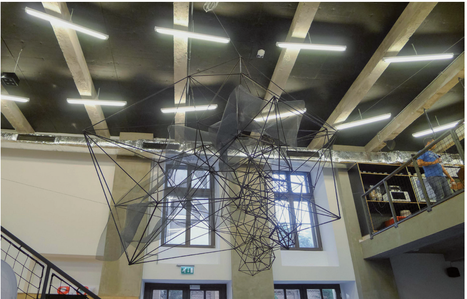
A legtöbb – az FKSE hagyományörző éves kiállítása, 2014, Budapest | KÚTVÖLGYI-SZABÓ ÁRON (Prezi székház)