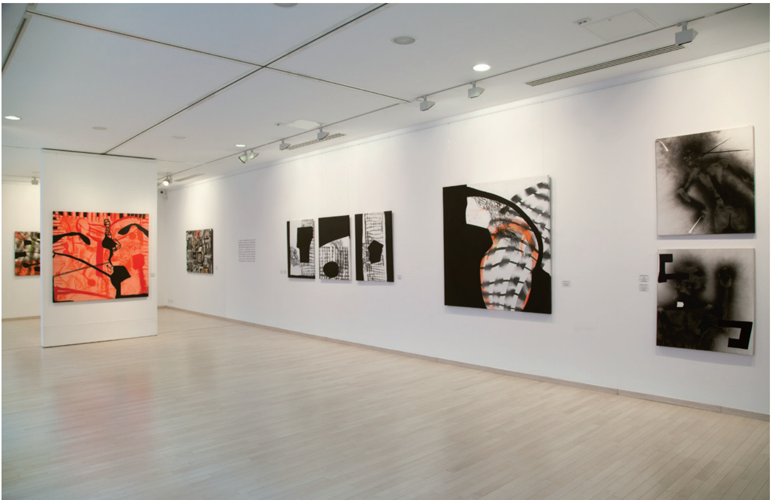
SZIRTES JÁNOS Éjféli, Várfoke Galéria, Budapest, 2014