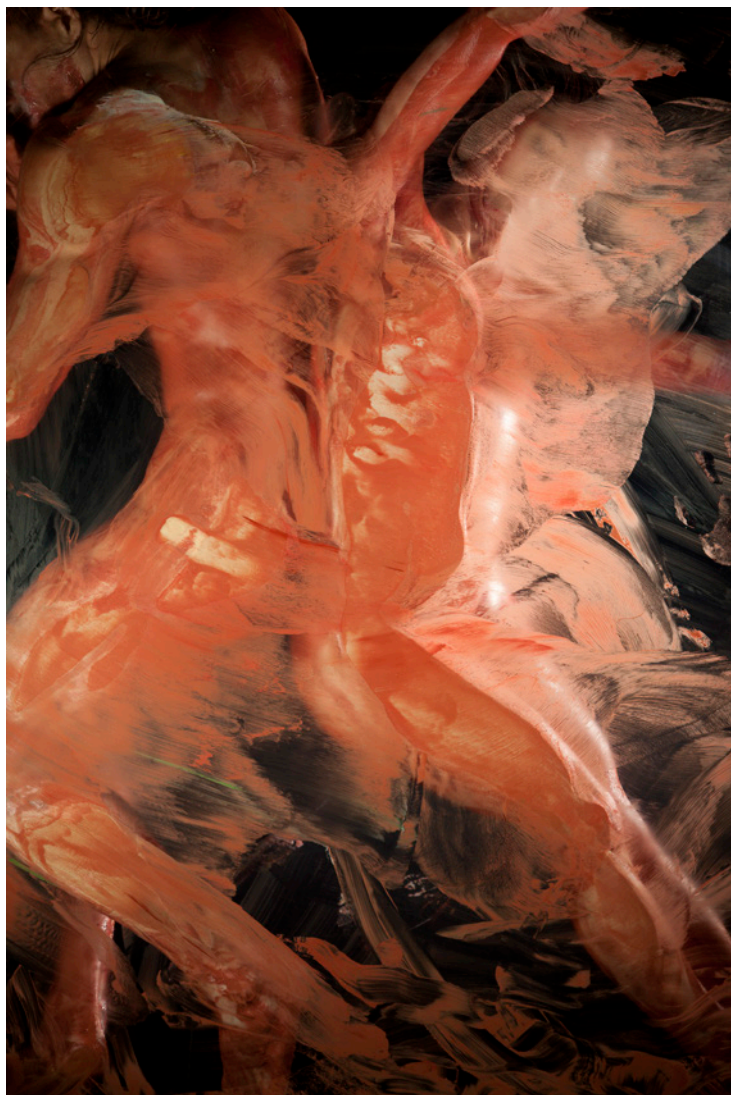
SZIRTES JÁNOS Éjféli II., 2014, inkjet print, alu-dibond lemez, 105×70 cm