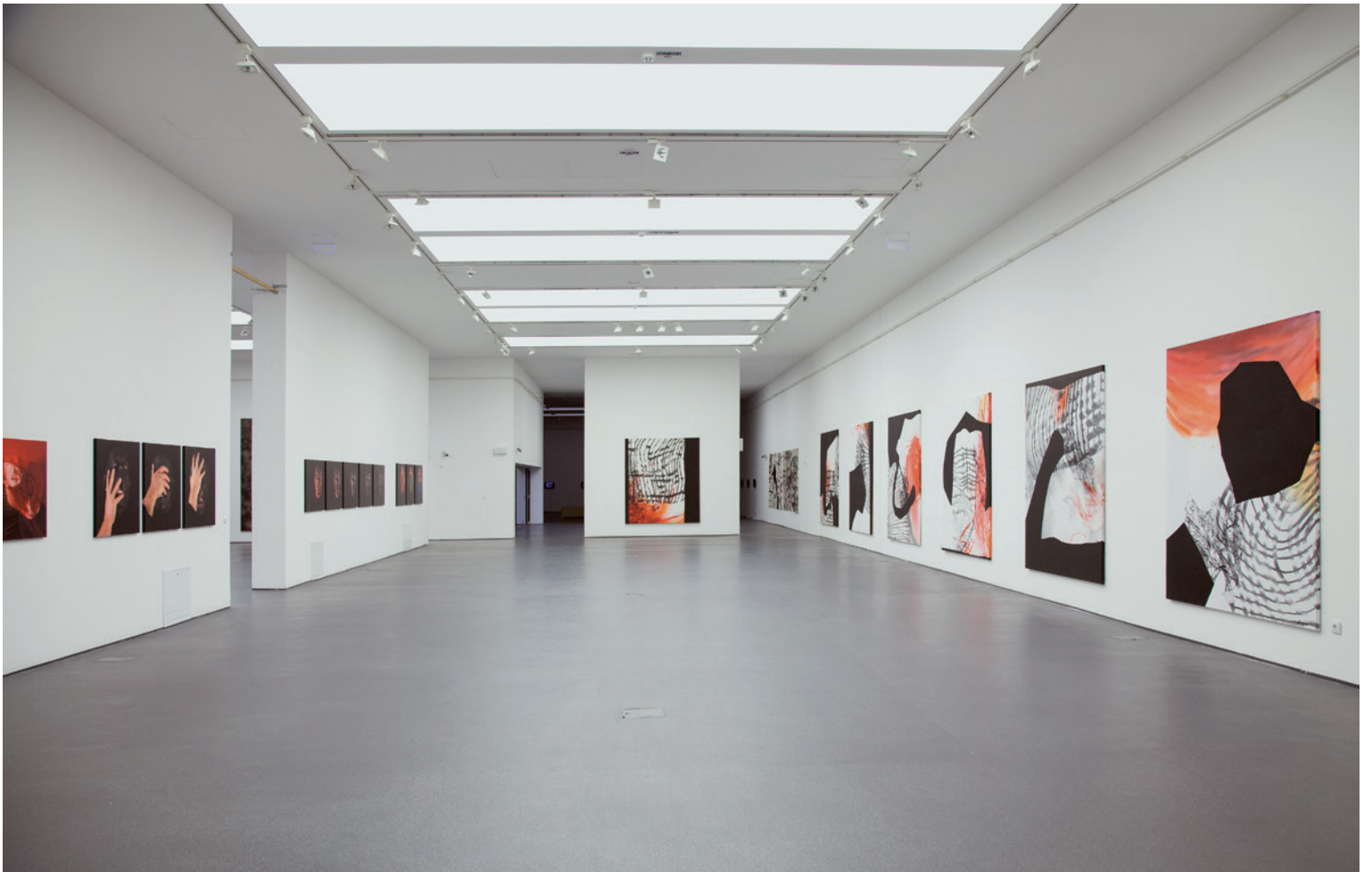
SZIRTES JÁNOS Pro/Contra, m21 Galéria, Zsolnay Kulturális Negyed, Pécs, 2014