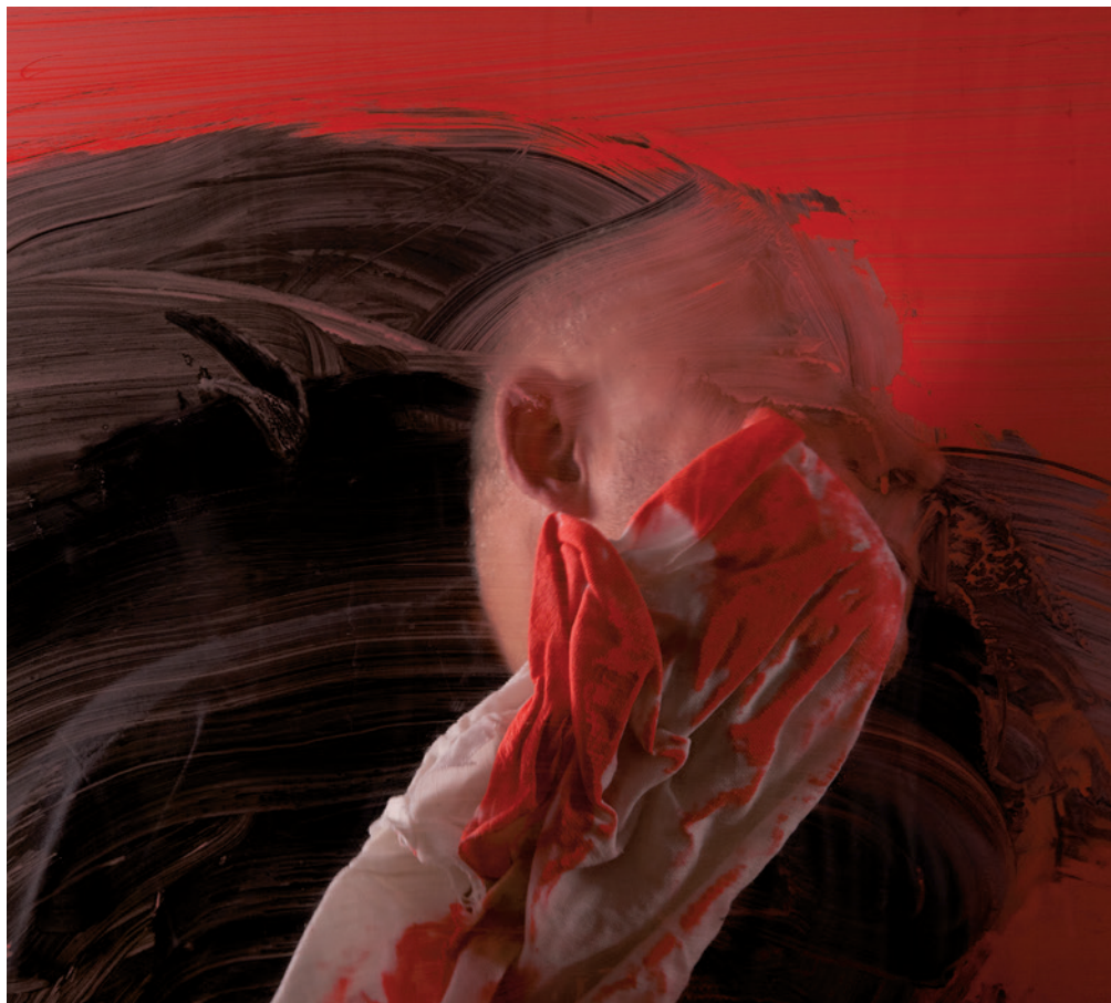
SZIRTES JÁNOS Pasztózus vörös IV., 2012, inkjet print, vászon, 80×90 cm