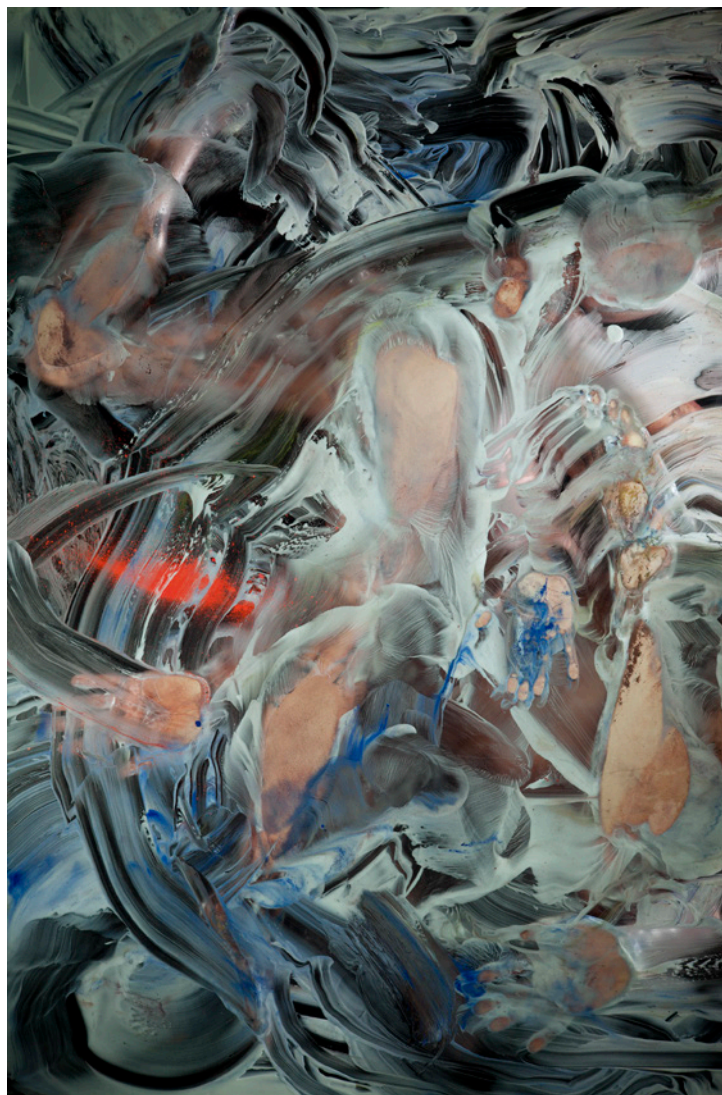
SZIRTES JÁNOS Éjféli V., 2014, inkjet print, alu-dibond lemez, 105×70 cm

a munkáin a korai egzisztenciális, a lét alapkérdéseit firtató fajsúlyos problémáktól mintegy eltávolodva egy szemlélődő, a résztvevő aktus során a saját pozíció reflektáltságát tudatosan hangsúlyozó szerepet vesz fel. Nyilvánvalóvá válik, hogy „mai” munkáinak más a tétje, mint a korai, a nyolcvanas évek expanzionista programjának. A művész ugyanis nem kevesebbre vállalkozik, mint a valóság vizuális eszközökkel történő értelmezésére, s ezzel együtt hozza létre saját látványalapú valóságkonstrukcióit.