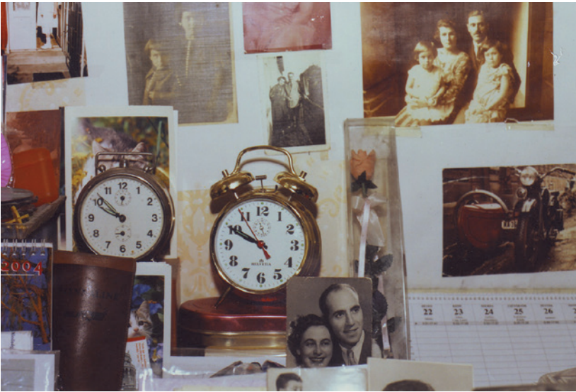
SZÁSZ LILLA műve, 2013, 10,5×15 cm