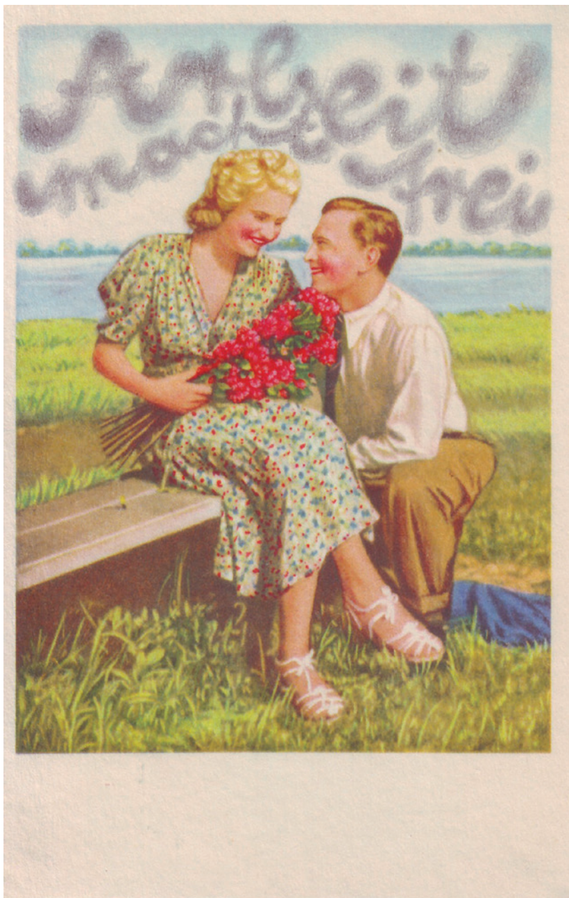
RÁCMLNÁR SÁNDOR műve, 2013, 15×10,5 cm