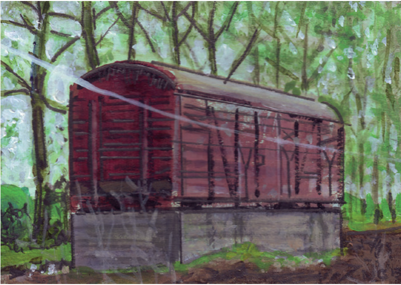
NEMES CSABA műve, 2013, 10,5×15 cm