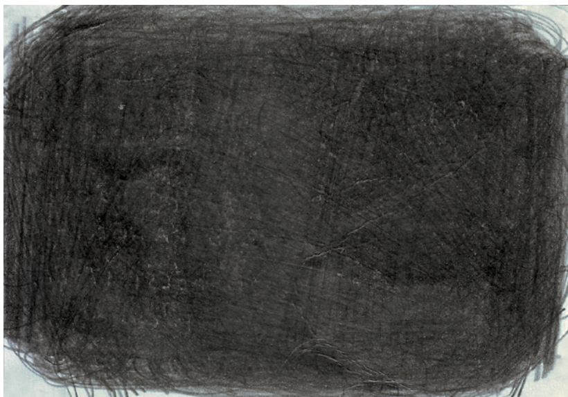
VÁRNAGY TIBOR műve, 2004, 10,5×15 cm