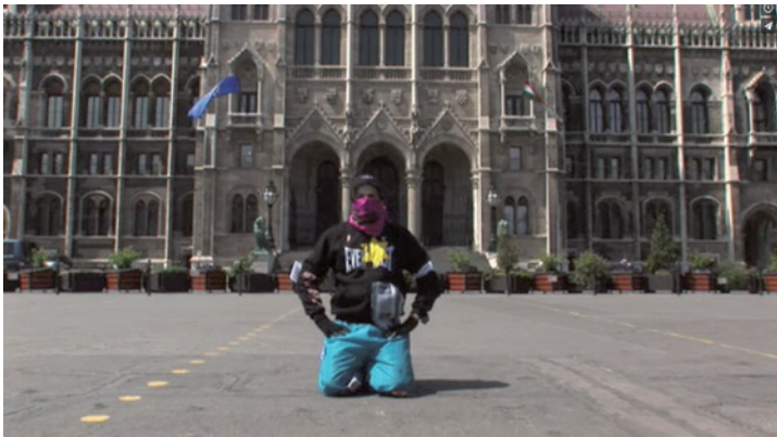
BORSOS JÁNOS Nemzeti Térdeplés, 2009, videó, 2'07"