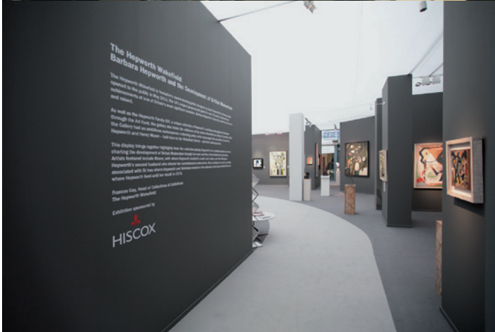
London Art Fair, 2014