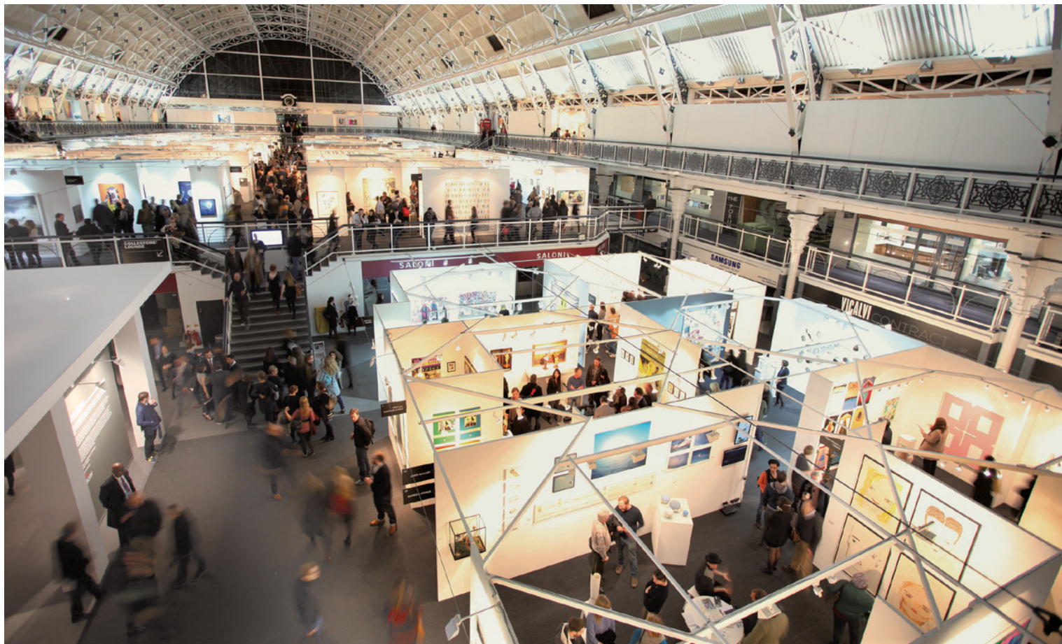
London Art Fair, 2014