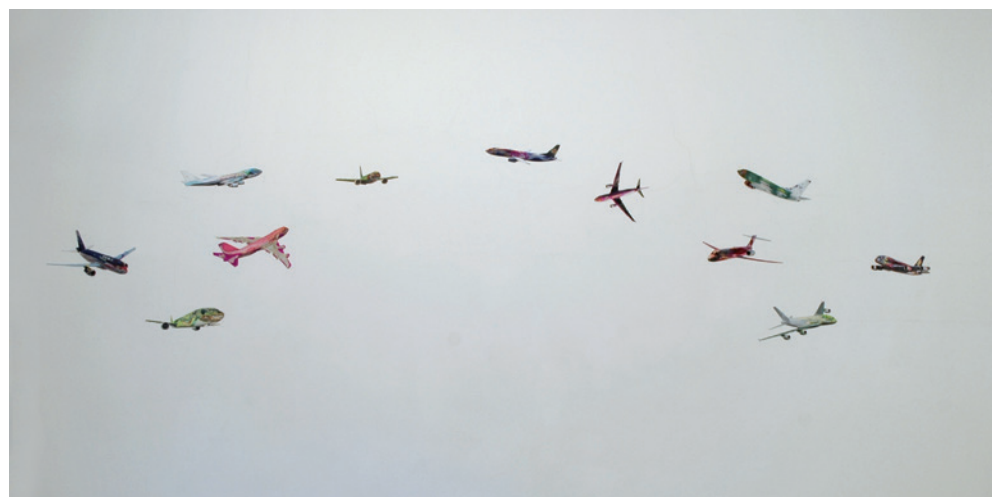
KEREKES GÁBOR Sárkányok, 2013, változó méret