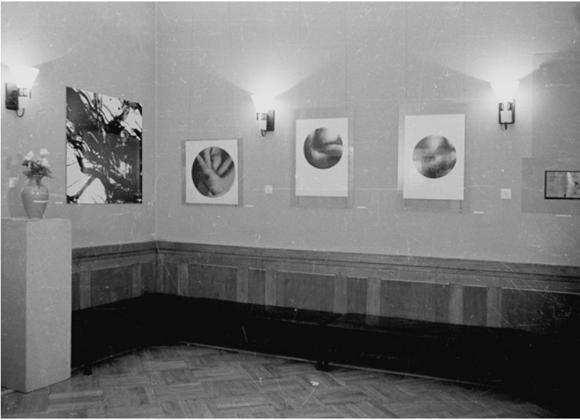
Kiállítási enteriőr Erdély Miklós, Haris László, Baranyay András és Lakner László műveivel.