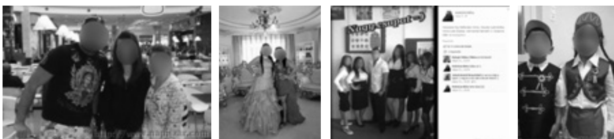
„Ez már a totális mélyszegénység...”

A következő megjelenített motívumok a roma és a magyar kultúra és identitás szembenállításáról szólnak. A roma származású hírességek ugyanúgy gúny tárgyát képezik, mint a sajátosan roma öltözképek titulált viselet. Az „ő” viseletük tehát nem a „mi” viseletünk. A mellékelt képeken láthatjuk, hogy roma iskolások magyar címer előtt állnak, egy másikon pedig magyar népviseletben vannak. Ez pedig pontosan azért helytelenített viselkedés, mert a két csoport szemben áll egymással, és ennek alátámasztására jól elkülöníthető jegyekre van szükség.