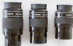
SWAN okulárok 14 800 Ft-tól

Tel: 06-20-432-5555 vagy 0043-676-526-528-0 Bemutatóterem: 1112 Budapest, Dobogó út 57