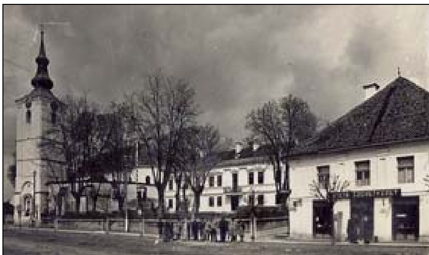
A hajdani Barót