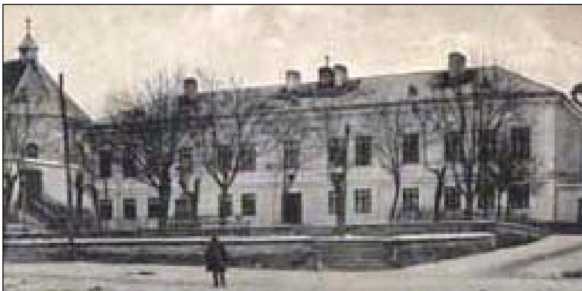
A baróti római katolikus népiskola

vonatkozásokon kívül igen értékes információkat kaphatunk, például, hogy Vályi Gyulának évfolyamtársa volt Veress Vilmos, aki Veress Pál matematikaprofesszor édesapja volt (és akiről hosszabban írtam a kolozsvári Szabadságban [2] és közlésre benyújtottam egy dolgozatot a Matematikai Lapok részére). De Vályi Gyula többi, kiváló előmenetelű évfolyamtársairól is információkat olvashatunk a Bartha-levelekből. A korabeli Erdélyben uralkodó áldatlan oktatási állapotokról is körképet kaphatunk.