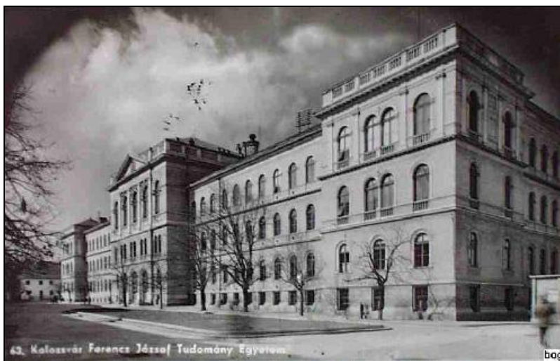
A Ferenc József Tudományegyetem századfordulón épült székhelye

Több mint nyolc évvel később, 1881. január 14-én kapja a Magyar Királyi Ferenc József Tudományegyetem nevet, és „örökidőkre megalapítottnak nyilvánított”.