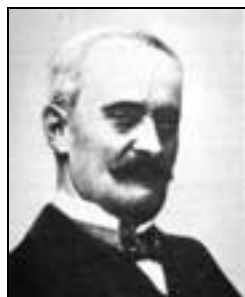
Farkas Gyula (1847–1930) Kolozsváron 1887–1915 között

Ha megismerjük a kolozsvári egyetem történetét, akkor nyugodtan állíthatjuk, hogy felszámolása felért egy szellemi holokauszttal.