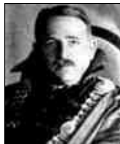
Riesz Frigyes (1880–1956) Kolozsváron 1911–1919 között