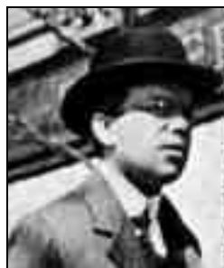
Fejér Lipót (1880–1959) Kolozsváron 1905–1911 között