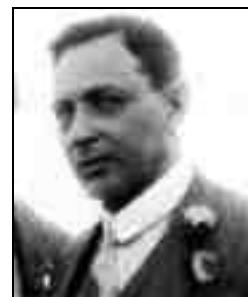
Haar Alfréd (1885–1933) Kolozsváron 1912–1919 között