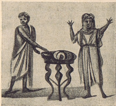
Szentmiseáldozat bemutatása. Freskó a Callisto-katakombában.

Már előbb említett felosztásunk második csoportjával van némi vonatkozásban az a két ábrázolat, mely a Callisto katakombában híres szentségi sírkamráiban látható. Azonban mivel a Szentírásra való utalás, mint azonnal látni fogjuk, még igen burkolt formában jelentkezik, viszont pedig a szimbolizmus világos, azért e csoport keretében emlékezünk meg róluk. Mindkét kép csekély különbséggel ugyanazt a jelenetet ábrázolja és mindkét helyen, ahol előfordul, ugyanannak a képsorozatnak egy-egy láncszemét alkotja. E képeken a középhelyet az áldozati oltár, a római régiség-tanból jól ismert tripós (három lábú asztalka) foglalja el és rajta mindkét esetben ismét kenyér és hal vehető észre. Már magábanvéve így is világos lenne a jelentés: az Ichthys kenyér színében az áldozati oltáron. Azonban ezzel a kép alkotója még nem elégedett meg. Az egyik esetben ugyanis a csodálatos kenyérszaporításra emlékeztető hét kosárral veszi körül az oltárt és így egy közismert szentírási előképpel támasztja alá a jelentést, míg a másik helyen már csaknem az áldozati aktus reális ábrázolásához jut