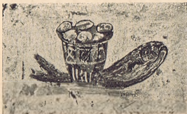
«Ichthys» a kenyérrrel és borral. (Lucina-katakomba.)

A Lucina-katakombában az egyik fülke falait két szimmetrikusan elhelyezett freskó ékesíti, melyeket bár erősen kikezdett az idő — mint a katakombai képeket általában — de amelyek mégis kimondhatatlanul becsesek ránk nézve, mert tiszta szimbolizmusukkal napnál fényesebben beigazolják az első keresztények hitét az Oltáriszentségben. A freskók ugyanis a legelterjedtebb ókeresztény jelképet, a Krisztus Urunkat szimbolizáló halat hozzák a kenyérrrel és borral a rajzolási technika által elérhető legbensőbb összefüggésbe. Zöld alapon két hal látható és ezek hátán, vagy mások megfigyelése szerint: megett, mindenesetre azonban teljesen egybefüggőleg a kenyereskosár, illetőleg üvegedény borral. Hogy a hal, az Ichthys, a katakombáknak egyéb jelekből is kimutathatólag tisztán keresztény traktusában az édes Üdvözítőt jelenti, az nem szorul bizonyításra, legfeljebb az okozhat egy kis nehézséget, hogy miként lehet a kenyereskosárban és üvegedényben az Oltáriszentség színeire ismerni. De ez a kétségünk is mindjárt eloszlik, ha meggondoljuk, hogy az ókeresztények tényleg kosárba gyűjtötték össze a Szentmiseáldozatra felajánlott kenyereket és ugyancsak kosárban őrizték consecratio után is az Eucharistát, így vitték például a betegekhez, sőt az üldözések