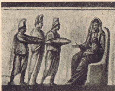
Napkeleti bölcsek. Callistus-katakomba.

Bár nem szóltunk még a szarkofágokon található ókeresztény Mária-képekről, valamint a katakombai leleteken, különösen az aranyozott üvegeken levőkről sem, amelyekről újabb tanulmányt lehetne összeállítani és viszont csakis a római katakombákra szorí-