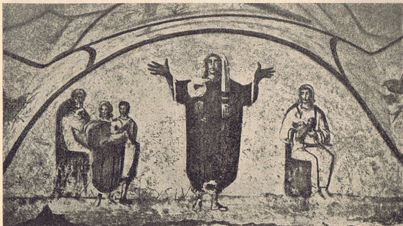
Mária-kép (jobbra), egy Istennek szentelt szűz avatásának freskóján. Priscilla-katakomba.

Ugyanebben az ősrégi katakombában még több Mária-képet