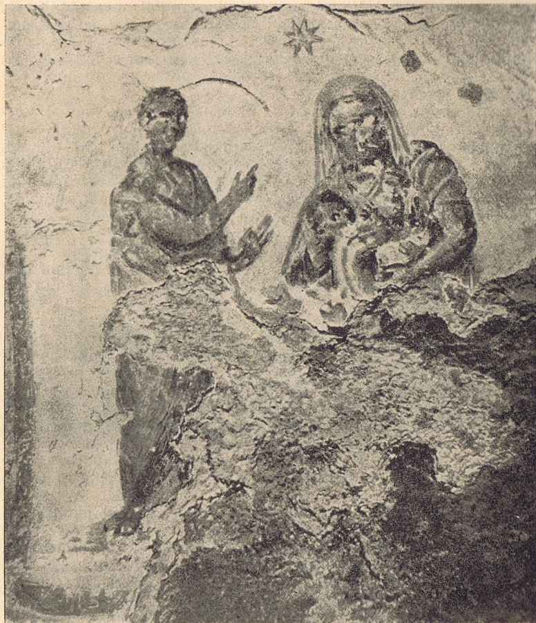
Mária-kép a Priscilla-katakombában.

főképp a vértanúk tisztelete visszanyunk az egyház történetének legrégebbi évtizedeiig. Azonban a Boldogságos Szűzre vonatkozólag