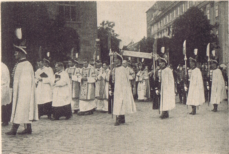
Részlet az úrnapi körmenetből.