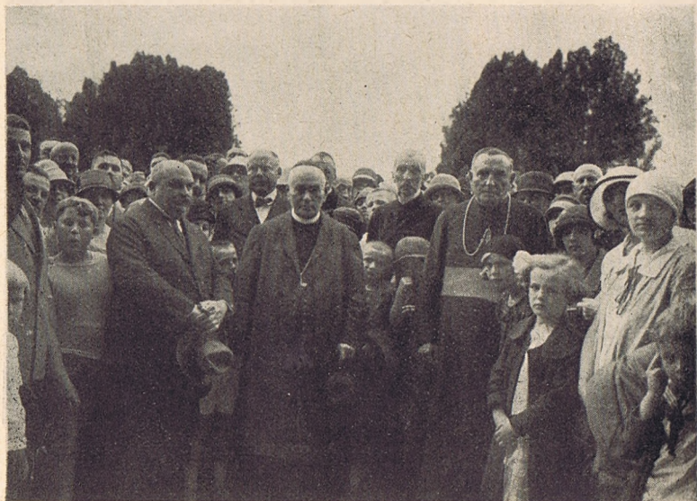
A magyar katolikusok Szent István-napi hódoló tisztelgése Csernoch János dr. bíboros hercegprímásnál Esztergomban.

December 12-én Csernoch János dr. bíbornok hercegprímás felszentelte az Egyetemi-templom négy új harangját.