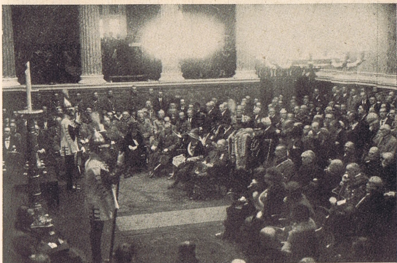
I. Ferenc József apostoli királyunk halotti maszkját átadják a Nemzeti Múzeumnak.