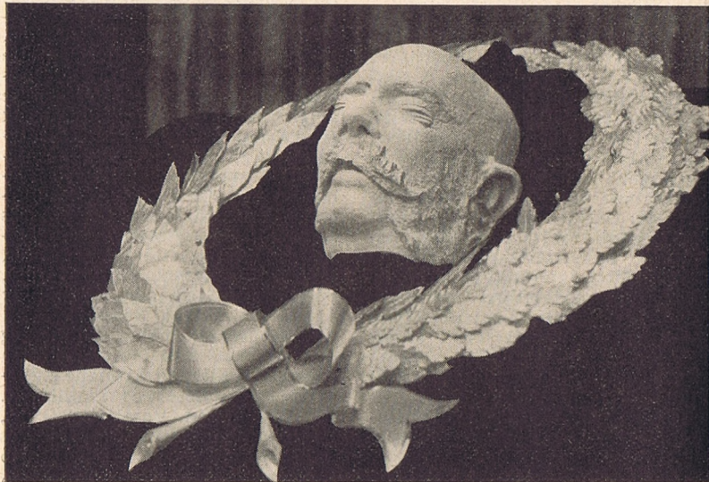
I. Ferenc József apostoli király halotti maszkja.

Ezen a napon volt a Katolikus Egyházközségek központi tanácsának költségvetést tárgyaló ülése, amely után a Középponti Katolikus Körben az Országos Katolikus Szövetség és a