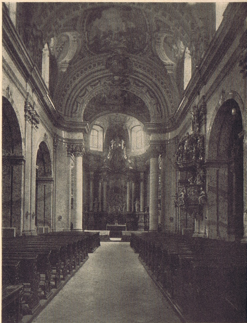
Az egykori budapesti Pálós-, mostani egyetemi templom újjáalakított belseje.