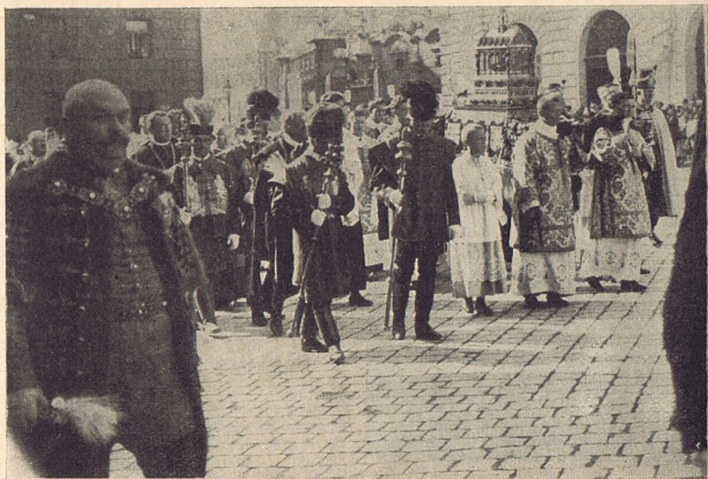
Szent István-napi országos szent Jobb-körmenet.

Augusztus 21. A szent István-napi ünnepségek befejezéseként az Országos Katolikus Szövetség zarándoklást rendezett Esztergomba, a magyar katolikus egyház fejéhez. A zarándoklás más-