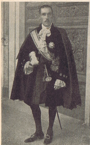
Colonna herceg, pápai trónálló.

A négy «di Fiocchetti» prelátus: az apostoli kamara uditoréja, főkinestárnoka, a pápa főudvarmestere s a belügyminiszter. Az érsekek és püspökök kineve-