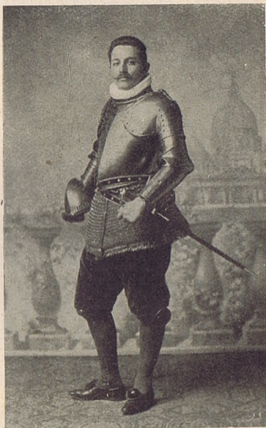
A svájci testőrség tisztje.