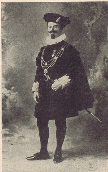
Pápai világi kamarás.

sorrendet, amelyben a különféle méltóságokat viselők a nagy pápai ünnepségeknél megjelennek. Ez a sorrend a következő: