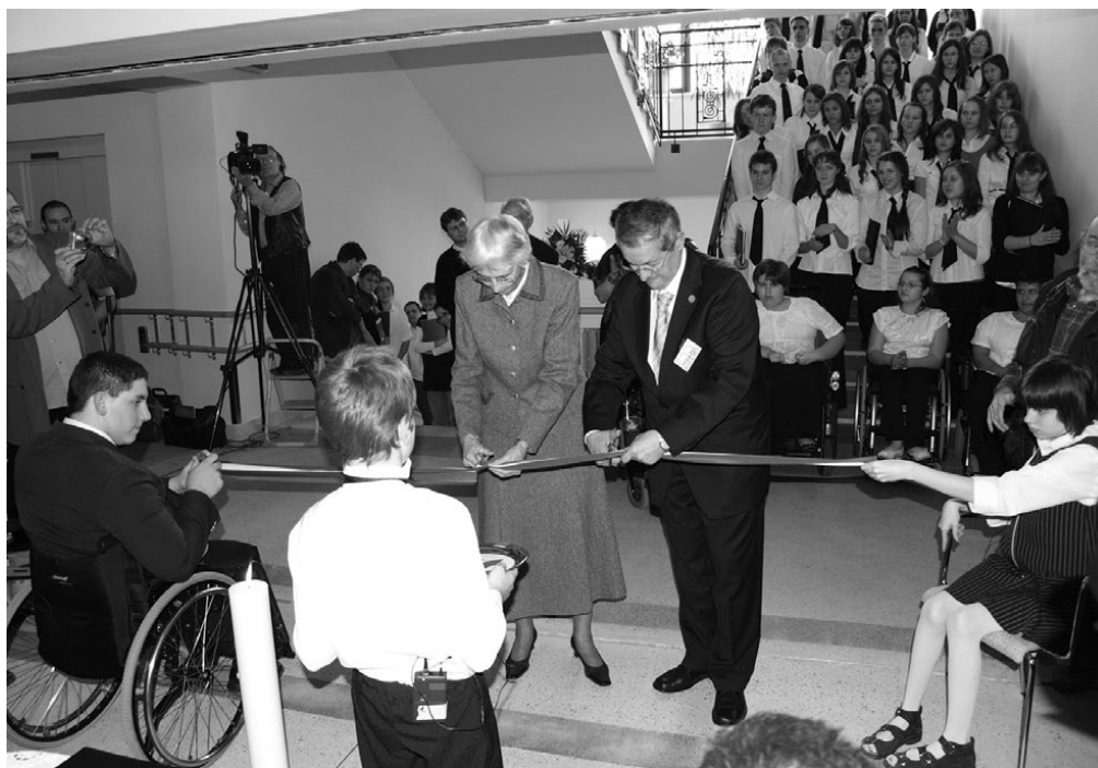
7. kép: Házaavatás – Mádl Dalma asszony és Nádás Pál igazgató úr.

Mádl Dalma asszony, a Magyar Köztársaság volt elnökének felesége, a szalag átvágásával adta át Nádás Pál igazgató úrnak, a munkatársaknak és a tanulóknak a „HÁZ”-at.