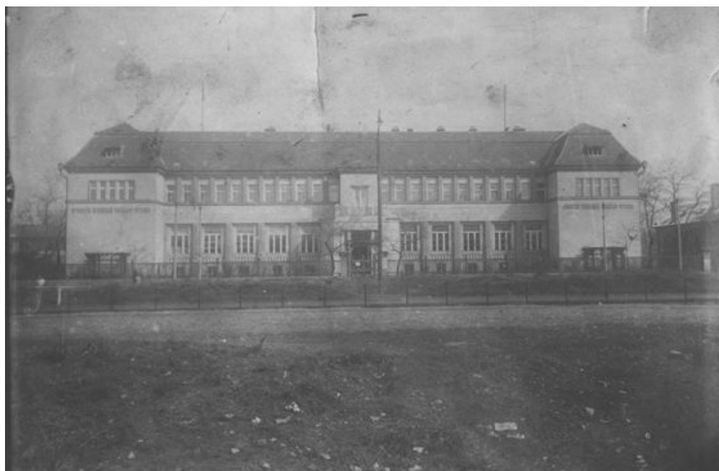
2. kép: A Nyomorék Gyermek Országos Otthona

Az épületben elemi iskola, iparos tanonciskola működött olyan műhelyekkel, ahol 7 szakmában képezték a fiatalokat. Az intézmény internátussal együtt működött, és