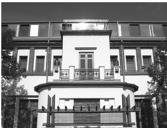
1 kép: A Medgyes-ház új bejárata (Mexikói út 63-64.)

2010. november 17-én délelőtt ünneplő közönség gyűlt össze a Mexikói úti mozgásjavító iskola új bejáratánál, a Mexikói út 63-64. szám előtt, az un. „Medgyes-ház” újszerűen kialakított bejáratánál. Ez az épület 2009. december 15-ig a közismert Weil Emil Kórház, majd később az Uzsoki utcai kórház ortopédiai és traumatológiai osztályaként működő kórház otthona volt. 2006-ban Budapest Főváros Önkormányzat döntése alapján a Mozgásjavító Általános Iskola EGYMI és Diákotthon –