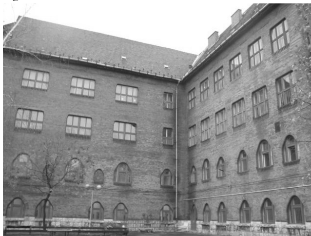
4. kép: A Mexikói út 60. sz. alatti Mozgásjavító Általános Iskola, EGYMI és Diákotthon régi épülete (az un. Lajta-ház)

A Lajta-ház (Mexikói út 60.) a háborút követő évtizedekben a kor szellemének megfelelően alakult, nemcsak mint az iskolai tanulókat ellátó általános iskola, hanem az iskolai keretek közötti sajátos rehabilitációs ellátás fejlődésében is. Évtizedek során a „ház” bővült az iskolai oktatást-nevelést kiegészítő rehabilitációs helyiségekkel, eszközökkel és szakszeméllyel, sportpályával, uszodával és a kertészképzővel. Ebben az épületben működött 1974/75-