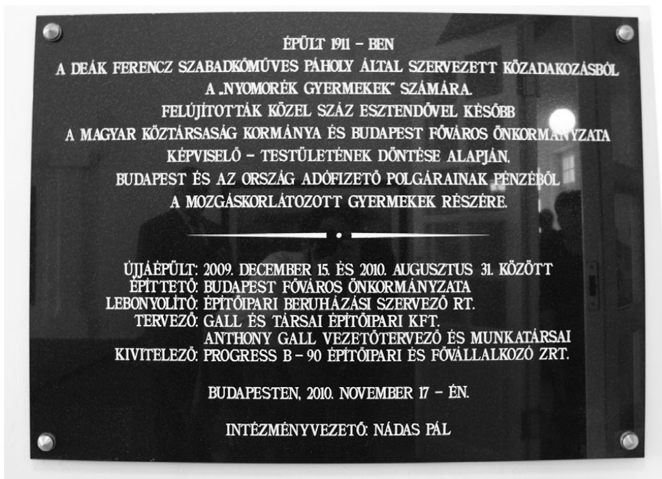
6. kép: A Medgyes-ház új táblája

Az intézmény régi-új épületének átadása ünnepi keretek között történt, és az újjáépített Medgyes ház régi bejáratánál emléktábla avatással kezdődött.