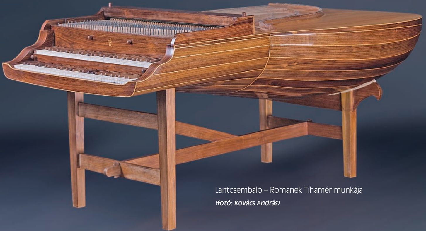
Lantcsembaló – Romanek Tihamér munkája

MEGALAKULT A NEMZETI ÉRDEKEGYEZTETŐ TANÁCS