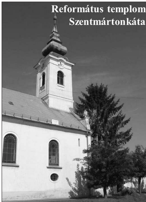
Református templom Szentmártonkátá

A megtérés az Isten munkája. Az az ember, akit Isten kézbe vett, az az ember nem passzív, hanem aktív. A megtérés csodálatos dolog az ember életében.