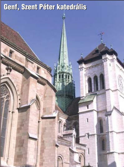
Genf, Szent Péter katedrális

„A Jézus Krisztus egyházának reformációja vagy megújulása Isten ajándéka Igéjén és Szentlelkén keresztül, akkor és úgy, amikor és ahogyan Ő akarja. Az egyház deformálódása, rombolása akkor következik be, ha az emberi szellem akarja az egyházra kényszeríteni terveit és szándékait” (Rajnai Hitvallás, 1933).