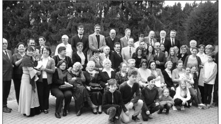
A konferencia résztvevői