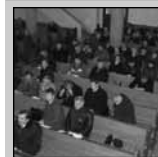
Kárpátmedencei presbiteri híradó (16-18. oldal)