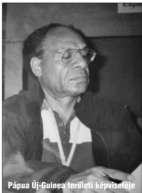
Pápua Új-Guinea területi képviselője

ga, hogyan növekedik robbanásszerűen a keresztyénség az ázsiai, afrikai és dél-amerikai földrészekben. Nekünk is meg kell erősödünk itt Európában és Magyarországon is. Misszióivá kell válnunk, és bezárt gondolkodásunkból ki kell lépünk – legalább tájékozódásban, de imádságban is – az Evangélium front-területei felé.