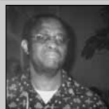
Testvéreink a nagyvilágban (6-7. oldal)