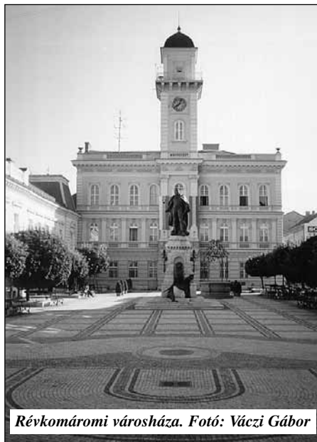
Révkomáromi városháza.

Amikor emberi világunk, a világ nagyhatalmai szinte belekényszerítenek mindenkit ebbe a gazdasági és így hatalmi versengésbe, féltő, hogy az értékek mind jobban háttérbe szorulnak, sőt deformálódhatnak, át is értékelődhetnek. Így válhat a tolerancia életellenes jelenségek megtűrésévé, a szabadság szabadossággá, a jólét hétköznapi anyagelvűséggé és az egyre tökéletesebb eszközök felhasználása egyre tökéletlenebb célok érdekében.