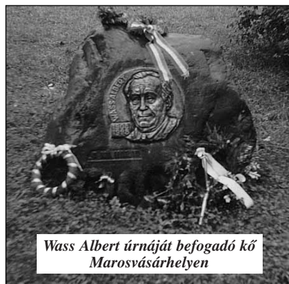
Wass Albert úrnáját befogadó kő Marosvásárhelyen