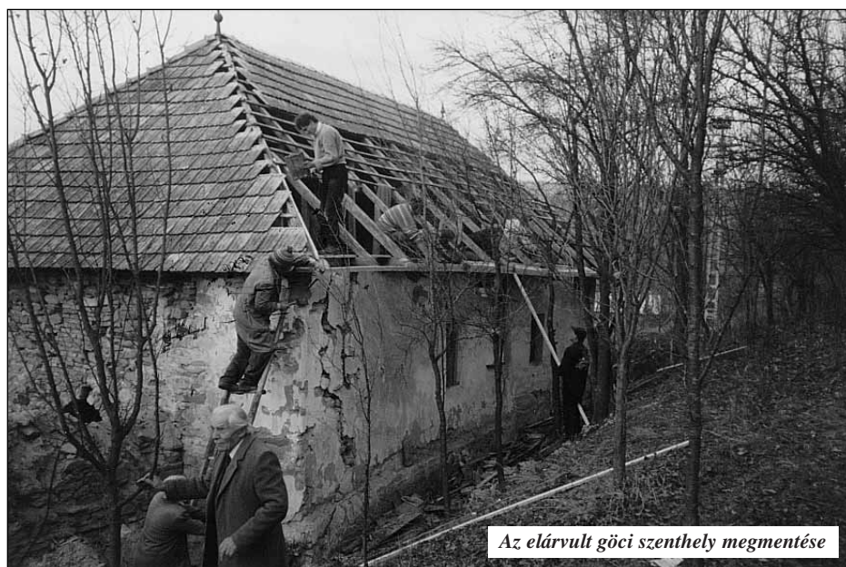
Az elárvult göci szenthely megmentése