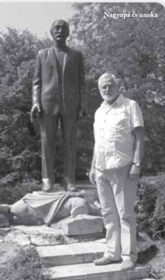
Nagyapa és unoka

Annak dacára, hogy románul jóformán nem is tudott, németül még valahogy, aztán elfelejtette azt is, ami gyermekkorában ráragadt, ez nem gátolta kapcsolataiban. Nádasi embereket