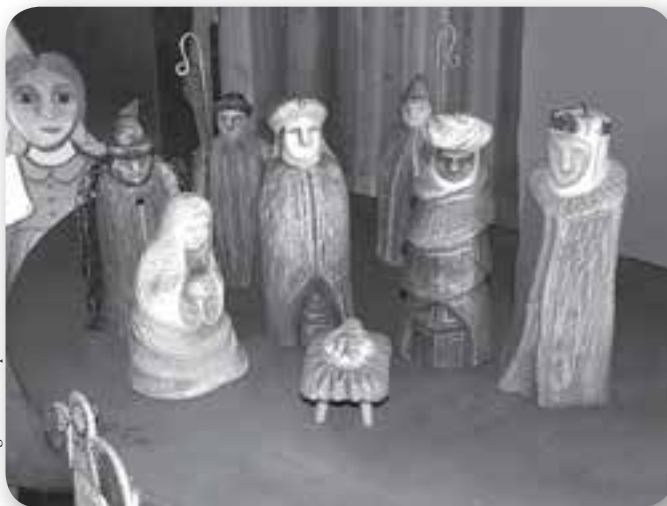
Az Ördögsekér-kompanya felvétele

Jézus születésének helyét, a jászolt ábrázolta, benne a szent családdal. A történet elmesélése után arra buzdították a házigazdákat, hogy legyenek könyörületesek, és adjanak