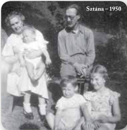
Sztána – 1950

A szántó-vetőnek is tudott tanácsot adni, mindennek utána olvasott. Imádta a könyvek tartalmát, illatát, a betűjét is. Írt is kézzel könyveket, ki is nyomtatta. Ez volt az ő hobbija. Felfedezték, hogy hű de szép az a Régi Kalotaszeg, jaj de gyönyörű az Attila királyról írt képes szöveg. Amikor fiatal építész lett, meghívták a Kemény Zsigmond Társaságba, ott felolvastatták vele az utóbbi írását. Kicsit zavarta, hogy nem mint építésznek lett sikere, hanem mint írónak. Egyszer megkérdeztem tőle, hogy tényleg, őt minek gondoljuk, építésznek vagy inkább írónak? Válasza egyértelmű volt: „Én mérnök vagyok, építész mérnök vagyok. Az az én tanult mesterségem. Ameddig lehetett addig terveztem, amikor jött a háború és leállt az építkezés, akkor kezdtem el írogatni.” Az írásaira is képi gondolkodás a jellemző: azt írta le, amit elképzelt, amit behunytt szemmel látott maga előtt.