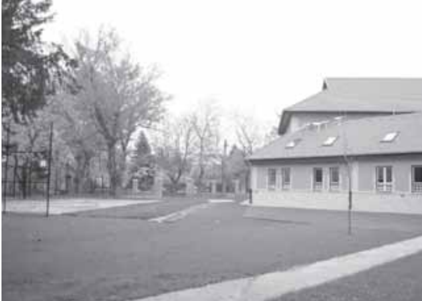
A második ütemben kívülről is megszépült az új tornacsarnok homlokzata és az udvar is

Megszépült az Erkel iskola udvara. A beruházás második ütemében többek között befejezték a tavaly átadott tornaterem külső homlokzatának festését, elkészült az aszfaltos sportpálya, a távolugró gödör, valamint az udvar füvesítése. Az építkezés befejezésére 70 millió forintot költött az önkormányzat.