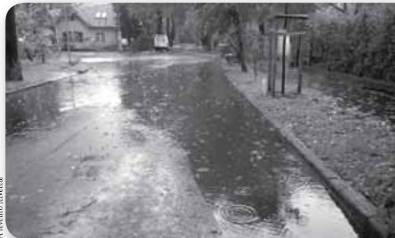
A levélró fűvétele

Az autósok is bosszankodnak, mert a tengelyig érő vízben való parkolás nem tesz jót a gépkocsinak.