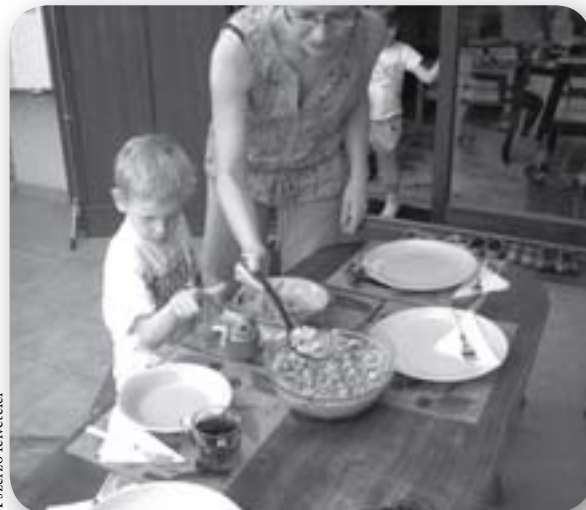
A szarzó felvételi