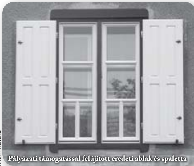
Pályázati támogatással felújított eredeti ablak és spaletta

Mint bizonyára már más forrásból is értesültek, nyár elején ismét megjelent két olyan pályázati kiírás, melyekre a wekerleiek sikerrel pályázhatnak. Az egyik a Budapest Főváros Közgyűlése által kiírt Műemléki Keret 2014. , a másik a Kispest Önkormányzata által meghirdetett Kispesti nyílászárók felújításának/cseréjének támogatása 2014. Mindkét pályázat ismerős lehet a korábbi évekből, hiszen lapunk tavaly decemberi számában már beszámoltunk a Műemléki Keret 2013.-ról (mely gyakorlatilag azonos feltételrendszerrel működik,