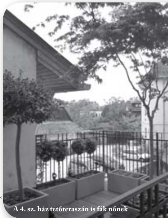
A 4. sz. ház tetőteraszán is fák nőnek

A téren körbehaladva az első nyitott épület a 4. számú ház volt, amelyet talán a legtöbben ismernek város-, sőt országszerte. A ház lakóközössége – mint ahogy arról már tavaly e lap hasábjain beszámoltunk – példászerűen felújította a nagy belső udvart, ebben az évben pedig elkészült a kisebb udvar is, valamint a két részt összekötő kis tetőterasz. A felújítá-