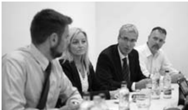
Egyeztetést hívott össze a wekerlei képviselőkkel és a BKK vezetőivel a Határ út forgalmának enyhítéséről

– Az egyik legfontosabb a házhoz menő szelektív hulladékgyűjtés bevezetése. A kék- és sárgafedelű kukákból ingyenesen szállítja el a hulladékot az FKF Zrt.. A másik Budapest teljeskörű csatornázása; itt Wekerlén is több utcában épült ki a hiányzó szennyvízhálózat. Emellett sikerült összehangolni a csatornarekonstrukciókat az útfelújítással a Corvin körúton és a Szent Imre utcában. A régi ólom vízvezeték-bekötések korszerűre történő cseréjét is megkezdte a Fővárosi Vízművek.