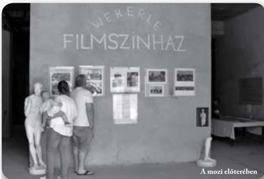
A mozi előterében