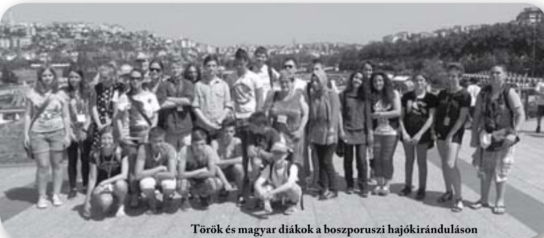
Török és magyar diákok a boszporuszi hajókiránduláson