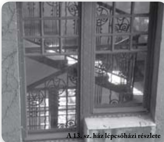
A 13. sz. ház lépcsőházi részlete