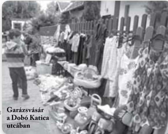
Garázs vásár a Dobó Katica utcában

Röviden összefoglalva arról szolt az egész napos program, hogy ma-