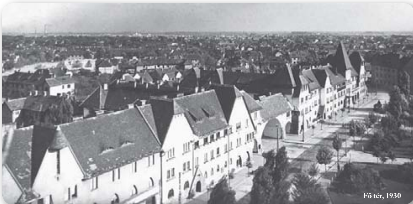
Fő tér, 1930

Kund (1915) – a Búvár K. nevű történelmi személy valójában Zotmund volt, aki 1052-