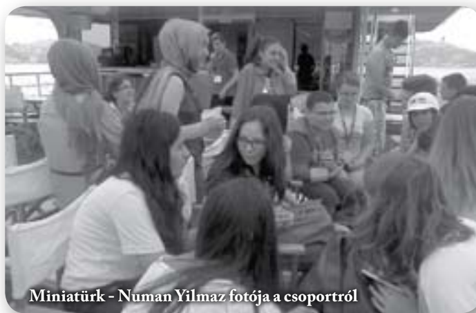
Miniatürk - Numan Yılmaz fotója a csoportról

A második hivatalos program a Thököly Imre Emlékház látogatása volt Izmitben, ahol megkoszorúztuk az emlékművet.