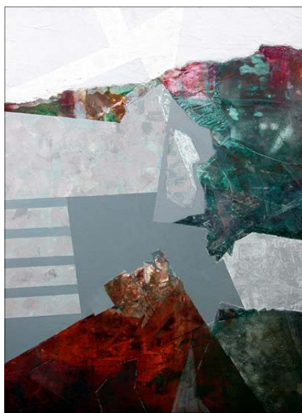
Fülöp Zoltán: Tűzfészek

Fülöp Zoltán éppen, mert mély tartalmak hordására törekszik a festészet eszközeivel, a közelmúlt történelmi eseményeit is képes absztrakcióval elénk tárni, biztosítva ezzel a múlt és jelen közti idő folytonosságát. TŰZFÉSZEK (80 x 60 cm) képével az '56-os forradalom barikádepítőire emlékez-