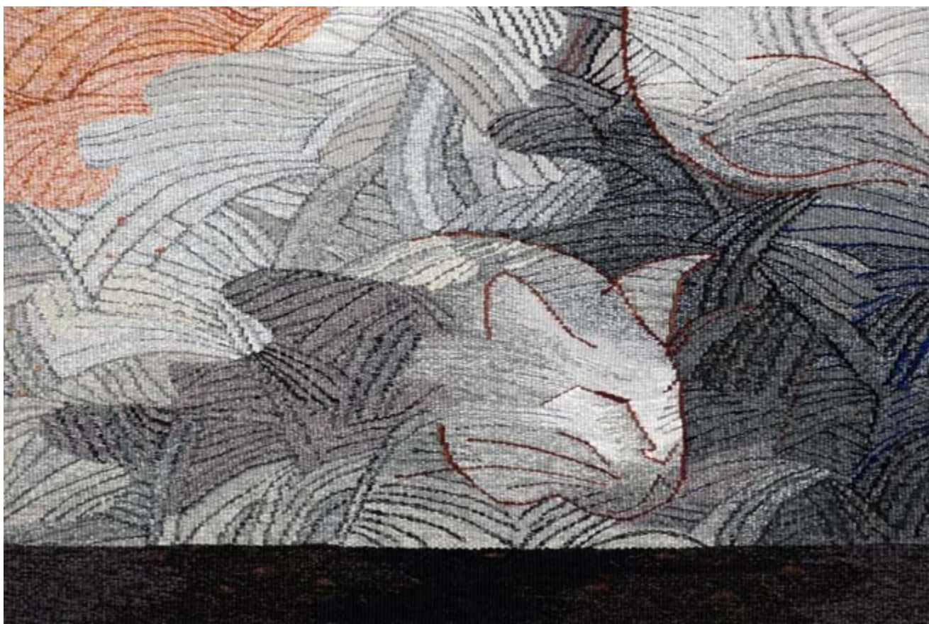
Bényi Eszter: Álom (részlet)

Forrás: Fitz Péter (főszerk.): Kortárs Művészeti Lexikon 1–3. Enciklopédia Kiadó, Budapest, 1999–2001.