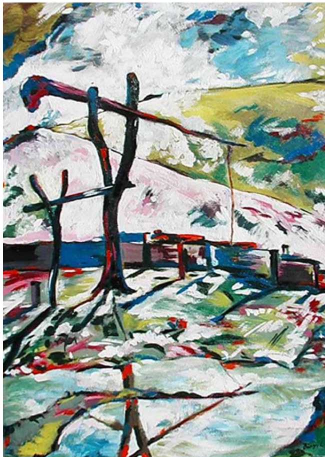
Bényi László: Gémeskút (olaj)

Bényi László mondta magáról: „Festésre mindig a természet hangolt. Képeimet spontánul váltották ki az évszakok színei, ezeknek nyílása és múlása éppen úgy foglalkoztatott, mint emborsorsok feletti tünődéseim és megrendüléseim.”