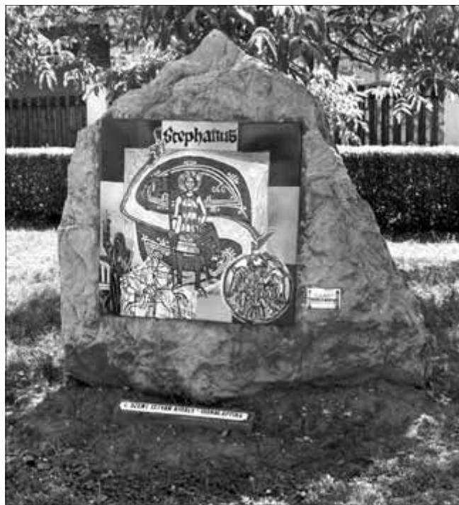
Morvay László: I. Szent István király – Honalapítás (tűzzománc, a harkányi kettős keresztút része)

Munkásságának másik vonulatát a középületekben, köztereken elhelyezett alkotások sora képezi. Ezek sorát a dobogókői BM Üdülő 1988-ban készült falképe nyitja. Ezt követi az édesanyja emlékének ajánlott Nagyvárad Vártemplom 1992. május 17-én felszentelt oltár képe a versekben megénekelte édesanyjának is emléket állító „Márta mama” oltár, és a 14 nagyméretű zománcokból álló keresztút. 1993. au-