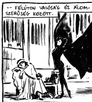
KONCEPCIÓ: HUDRA MÓNI • RAJZ: ORAVECZ GERGŐ