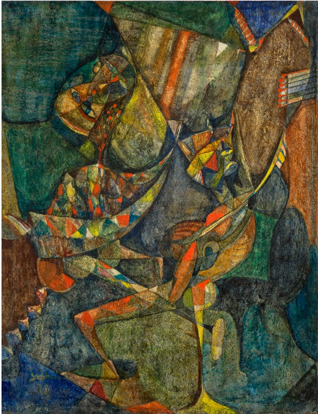
SZÓBEL Géza: Zenész Harlequin , 1934, olaj, fa, 120×95 cm ←

Klausz 30-as években készült, kis méretű pasztelképei egyszerre nyugóznak le virtuozitásukkal és a kis formátumon túlmutató, monumentális gomolygással, szín- és formaáramlással. Megidézik – különösen a kiállításon látható olajképeken – František Kupka orfizmusát és zenei hatású festményeit.